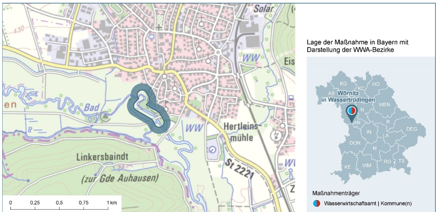
Abb. 1: Lage des Gewässerabschnittes, an dem die Maßnahme umgesetzt wurde