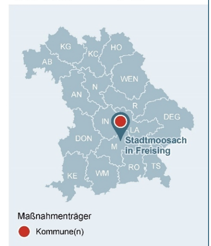
Abb. 1: Lage des Gewässerabschnittes, an dem die Maßnahme umgesetzt wurde

Lage der Maßnahme in Bayern mit Darstellung der WWA-Bezirke