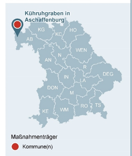
Abb. 1: Lage des Gewässerabschnittes, an dem die Maßnahme umgesetzt wurde

Lage der Maßnahme in Bayern mit Darstellung der WWA-Bezirke