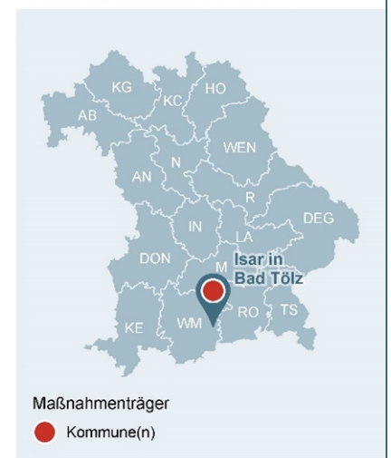
Abb. 1: Lage des Gewässerabschnittes, an dem die Maßnahme umgesetzt wurde

Lage der Maßnahme in Bayern mit Darstellung der WWA-Bezirke