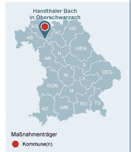
Abb. 1: Lage des Gewässerabschnittes, an dem die Maßnahme umgesetzt wurde

Lage der Maßnahme in Bayern mit Darstellung der WWA-Bezirke