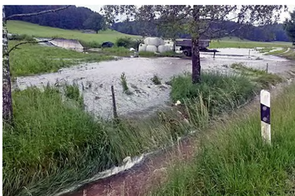
Abb. 2: Starkregen verursacht Oberflächenabfluss und damit auch Überflutungen fern von Gewässern

Mit dem Starkregen fällt viel Wasser auf die Erdoberfläche. Ist der Boden bereits gesättigt oder fällt mehr Regen als vom Boden aufgenommen werden kann, bildet sich Oberflächenabfluss. Dieser Effekt verstärkt sich, wenn der Boden zum Beispiel wegen starker Verdichtung oder durch Bebauung ohnehin wenig aufnahmefähig ist. Der Oberflächenabfluss fließt über das offene Gelände ab, sammelt sich in tiefer liegenden Bereichen und kann bereits vor dem Erreichen eines Gewässers beträchtliche Ausmaße annehmen und Schäden verursachen. Durch Starkregen kann also auch Hochwasser fern von Gewässern auftreten. Oft sind nach Starkregen auch die kleineren Bäche und Gräben betroffen. Bei sehr ungünstigen Bedingungen und extremem Starkregen kam es in der Vergangenheit auch in Bayern zu Sturzfluten. Das sind seltene, sehr schwere Hochwasserereignisse, bei denen katastrophale Schäden möglich sind und eine große Gefahr für Leib und Leben besteht.