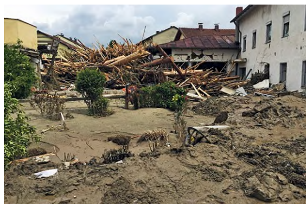
Abb. 3: Schäden nach der Sturzflut in Simbach am Inn im Jahr 2016