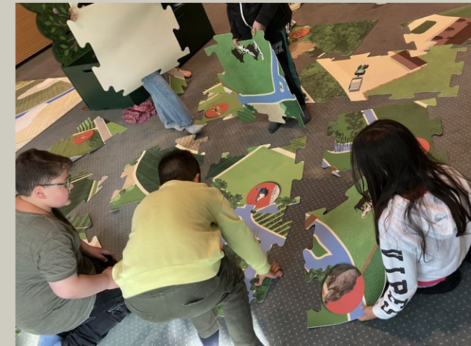
Beim Bodenpuzzle wird der Fluss in die Landschaft eingebettet