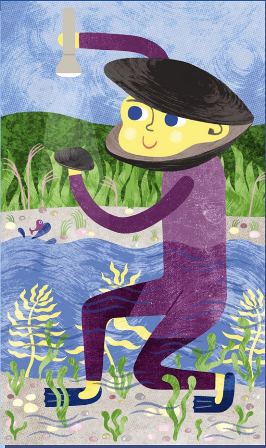
Botschafter-Figuren führen die Kinder durch die Ausstellung