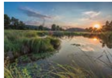
April Deusmauer Moor (Neumarkt in der Oberpfalz) „Sonnenuntergang im Deusmauer Moor“