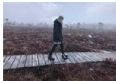
Januar Schwarzes Moor (Rhön-Grabfeld) „Schneegestöber im April“