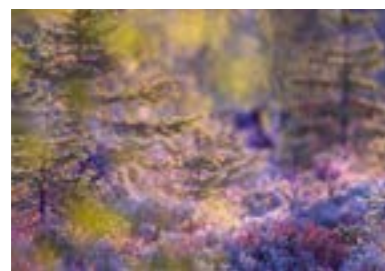
Mai Haspelmoor (Fürstenfeldbruck) „Gesponnenes Licht“