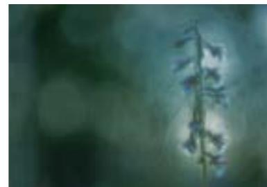
März Inzeller Filz (Traunstein) „Sumpfstendelwurz im ersten Tageslicht“