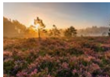
September Rothenrainer Moor (Bad Tölz-Wolfratshausen)  „Heideglühen im Morgenlicht“