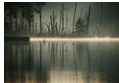
Dezember Schönramer Filz (Traunstein | Berchtesgadener Land) „Morgenerwachen im Moor“