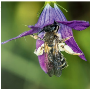
Manche Insekten sind auf eine einzige Nahrungspflanze spezialisiert, z. B. die Graue Schuppen-Sandbiene auf die Glockenblume.

Klassische Blühflächen bieten vor allem für die Spezialisten unter den Insekten oft nur wenig Lebensraum. Sie sind von naturnahen Lebensräumen wie beispielsweise artenreichen Wiesen und Waldsäumen abhängig, die auch einen hohen Wert für unsere heimische Pflanzenwelt und den Biotopverbund haben. In mehreren Teilprojekten untersuchen wir verschiedene Maßnahmen, um aufzuzeigen, wie die Insekten- und Pflanzenvielfalt am effektivsten gefördert werden kann.