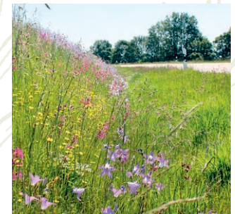
Wertvolle Lebensräume entstehen oft auch ohne den Griff zur Samentüte, z. B. durch Anpassung der regelmäßigen Pflege.

Die Übertragung von lokaltypischen Pflanzen aus artenreichen Spenderflächen in der nahen Umgebung bietet viele Vorteile gegenüber einer Ansaat mit gebietseigenem Saatgut. Im Idealfall werden so wertvolle Lebensgemeinschaften „kopiert“. In einem Kataster am Landesamt für Umwelt sollen künftig Informationen zu Spenderflächen gesammelt werden. Wir erarbeiten hierfür naturschutzfachliche Kriterien und erfassen neue Flächen für das Kataster, um Übertragungen in Zukunft zu vereinfachen.