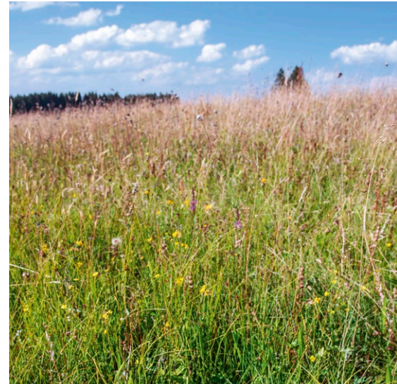
Bei dichtwüchsigen Beständen führt die mangelnde Lichtverfügbarkeit zu erhöhtem Längenwachstum (Detail linkes Bild). (Fotos: Alfred und Ingrid Wagner).

rasiger Vegetation führt. Generelle Empfehlungen zum Weidemanagement, etwa im Hinblick auf Besatzdichte und Weidezeit, sind kaum möglich, weil die Weideführung stark von den jeweiligen Eigenschaften der Weide, wie dem Verhältnis von Mineralboden- zu Moorbodenanteil, abhängt. In jedem Fall wichtig sind Kenntnisse zur ehemaligen Nutzung, die zur Habitateignung geführt hat. Grundsätzlich sollten Bestandskontrollen erfolgen, auch um auf etwaige Fehlentwicklungen reagieren zu können. Alleinige Streuwiesenmahd ist für die Erhaltung der Art nicht ausreichend.