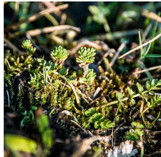
Die konkurrenzschwache Sumpf-Fetthenne besiedelt ähnlich wie der Kriechende Sellerie etwas nährstoffreichere, lückige Standorte.

In einem Großteil des einstigen Verbreitungsgebiets ist schon seit Anfang des 20. Jahrhunderts ein sehr starker Rückgang zu verzeichnen. Derzeit existieren nur noch etwa 15, meist über große Distanz isolierte Wuchsgebiete mit oft winzigen Populationen. Mit einer Abnahme von etwa 95 % der bundesdeutschen Quadranten nachweise (gegenüber vor 1980) gehört Sedum villosum zu den am