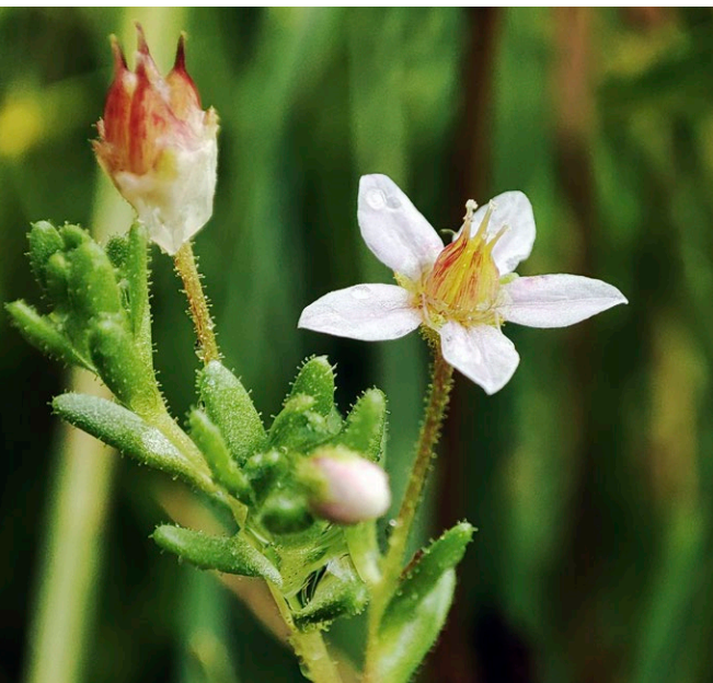
Sedum villosum in Vollblüte Anfang Juli

Familie: Dickblattgewächse (Crassulaceae)