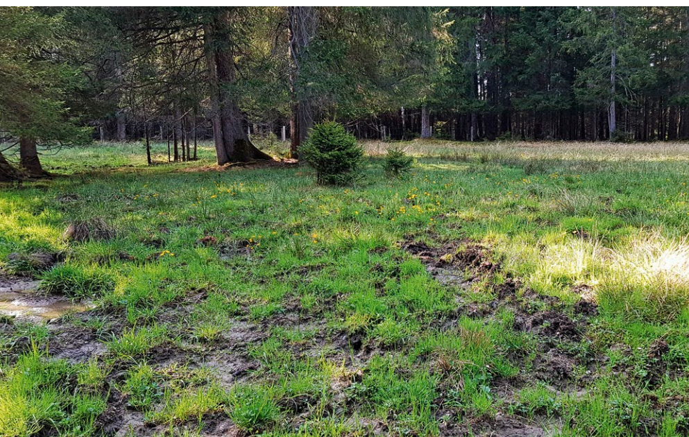
Viehtritt schafft immer wieder neue Rohbodenstellen und ermöglicht es der Sumpf-Fetthenne, Keimnischen zu finden.

Fast allen rezenten Wuchsorten ist der starke Bestandsschluss der Begleitvegetation gemeinsam. Dieser wird durch Nährstoffeinträge aus umliegenden Flächen sowie eine verringerte Nutzungsintensität begünstigt. Die wenigen vorhandenen offenen Bodenstellen können dadurch rasch wieder von konkurrenzkräftigeren Arten