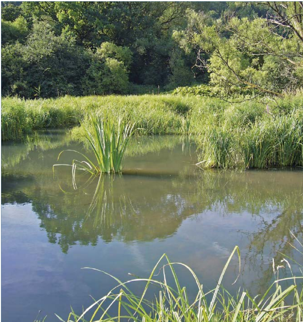
Abb. 20: Der Biber arbeitet für den Naturschutz, reguliert den Wasserhaushalt und schafft erholsame Landschaften für uns Menschen.

Biber haben sich vielerorts zu einem Qualitätsmerkmal für Erholungslandschaften entwickelt – sie locken sogar Urlauber an. In allen Teilen Europas sind in den vergangenen Jahren Biberlehrpfade angelegt worden. Exkursionen zu Biberrevieren sind sehr beliebt, die Teilnehmerzahlen zeugen vom großen Interesse an der Art. Bibertouren und -führungen können so zu einer neuen Einnahmequelle für den ländlichen Raum werden.