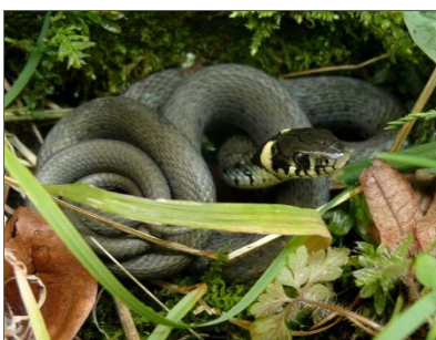
Abb. 10: Ringelnatter