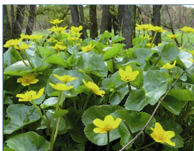
Abb. 11: Sumpfdotterblume