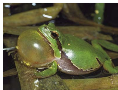
Abb. 12: Laubfrosch