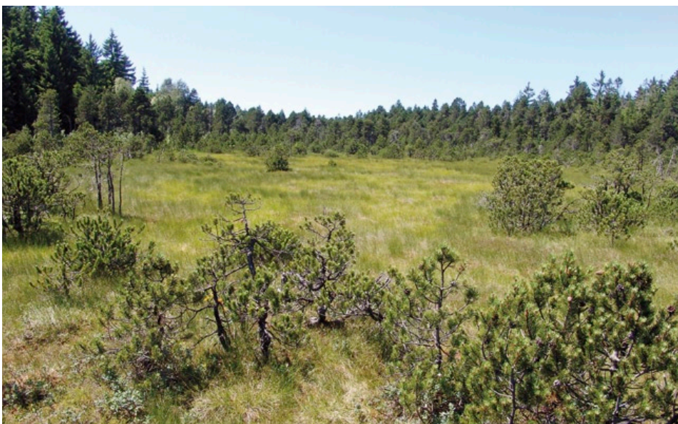
Weitgehend unbeeinflusstes Hochmoor. Am Fuße der Moorkiefern wachsen vereinzelt Rauschbeeren (Schönleitenmoos, Lkr. Oberallgäu, Foto: Hubert Anwander).

Der Hochmoor-Gelbling ist ein guter Flieger und kann – insbesondere bei der Nahrungssuche – mehrere Kilometer überbrücken. Auf diese Weise erreicht er auch benachbarte Hochmoore.