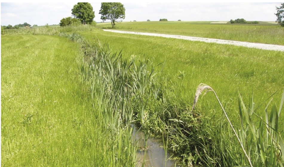
Lebensraum der Vogel-Azurjungfer an einem Wiesengraben im Lkr. Ansbach.

Die Vogel-Azurjungfer ist nach der Bundesartenschutzverordnung eine „streng geschützte Art“ und wird in den Anhängen II und IV der FFH-Richtlinie geführt. Sie lebt im Gegensatz zu anderen gefährdeten Libellenarten oft in naturschutzfachlich weniger wertvollen Gewässern und kann daher mit den Mitteln des Flächenschutzes kaum gefördert werden. Vielmehr ist sie seit langem weitgehend angewiesen auf Sekundärlebensräume, die eng verknüpft sind mit der Wiesennutzung in vernässten Talauen. Die zur Erfüllung der sehr spezifischen Lebensraumansprüche oftmals erforderliche Ufermähd und gelegentliche Räumung der besiedelten Bäche und Gräben ist notwendig, um die Nutzungsfähigkeit der Wiesen zu erhalten. Insofern hängen die bayerischen Vorkommen der Art von der Fortführung einer tradi-