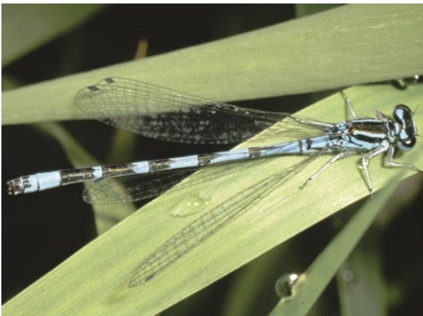
Männchen der Vogel-Azurjungfer.

Familie: Schlanklibellen (Coenagrionidae)