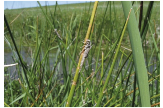
Exuvie von C. ornatum (im Bildhintergrund weitere Exuvie)

Die Vogel-Azurjungfer gehört zur ostmediterranen Refugialfauna (St. QUENTIN 1960). Ihr Hauptverbreitungsgebiet reicht von Südosteuropa über Kleinasien bis in den Iran und Irak (ASKEW 1988). Offenbar ist sie auch dort nicht häufig. Von den deutschen Nachbarstaaten liegen Nachweise aus Österreich, Polen und Frankreich vor. Fundorte in der Schweiz und in Italien gelten als erloschen (WILDERMUTH et al. 2005, STOCH 2003). Die Vorkommen der Vogel-Azurjungfer in Deutschland liegen weit