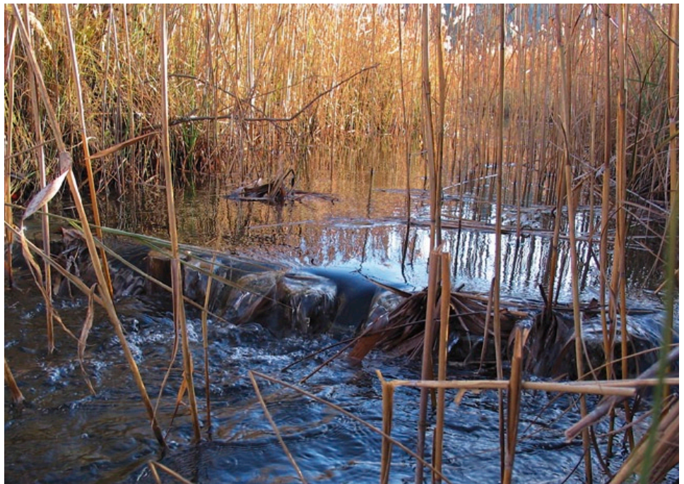
Zur Anhebung des Wasserspiegels in einem Quellmoor wurden in Gräben fünf Stau mit einer Höhe von jeweils etwa 0,25 cm eingerichtet.

Ein wesentlicher Aspekt sind auch Beeinträchtigungen des Nähr- und Mineralstoffhaushalts durch: