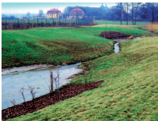
Abb. rechts: Umgebauter Graben nach 5 Jahren