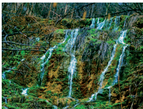
Abb. links: Aufgeweiteter Bach