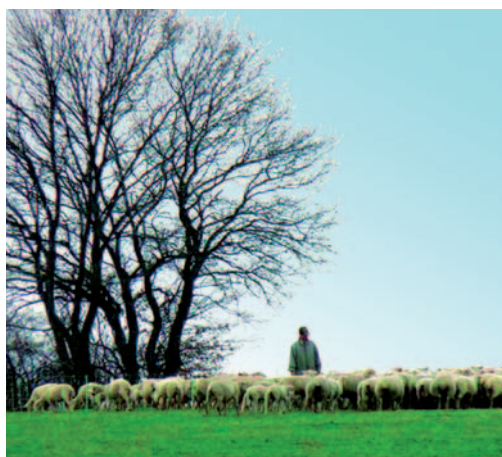
Abb. links: Mahd mit Mähbalken