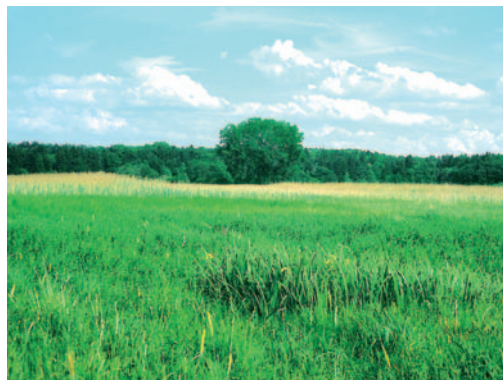
Abb. links: Trollblume