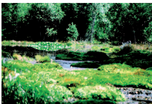
Abb. rechts: Streuwiese