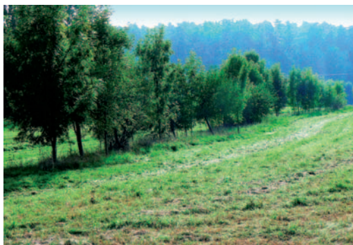
Abb. rechts: Kopfleidenreihe