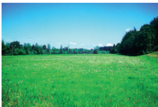
Abb. rechts: Feuchtgrünland mit Gehölzen