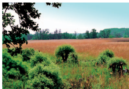
Abb. links: Seggenreiche Nasswiese