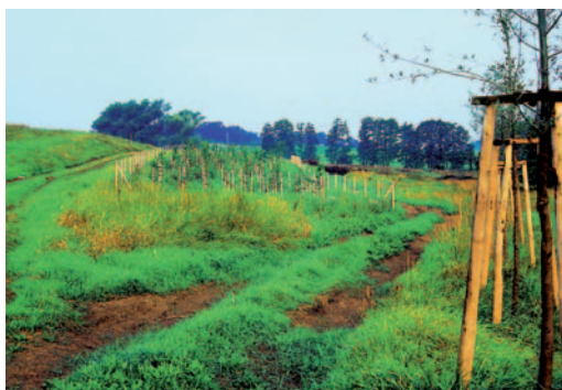
Abb. rechts: Streuobstwiese