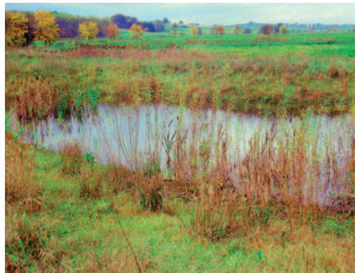
Abb. links: gebänderte Prachtlibelle