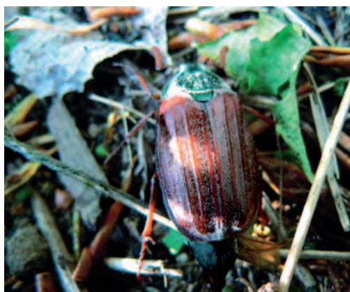
Abb. links: Baumhecke an Wiesenweg