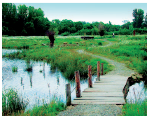
Abb. links: Neu angelegter Tümpel