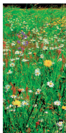
Abb. links: Magere Klappertopfwiese