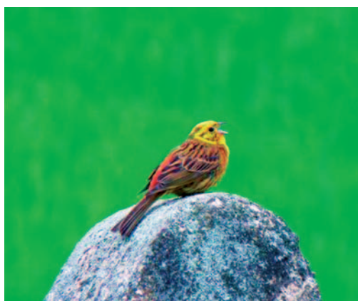
Abb. links: Streuobstwiese