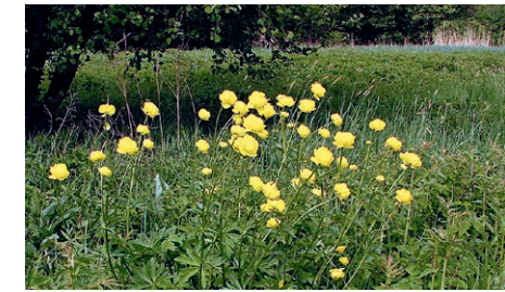
Feuchtwiese mit Trollblumen und Seggen

Der beinahe ganzjährig nasse Gleyboden bietet im besonderen Maß Lebensraum für seltene Pflanzen, die mit der Dauerfeuchte umgehen können. Im Wald sind zum Beispiel der Sumpf-Pippau und auf Feuchtwiesen die Trollblume oder verschiedene Seggen anzutreffen.