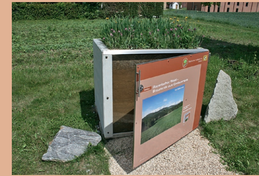
Bodenfenster (Station 4) ▶