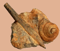
Belemnit (Teufelsfinger) mit Schnecke

Herzlich willkommen am Bodenerlebnispfad Flintsbach! Bei einem Spaziergang von ca. 800 m Länge können Sie mit allen Sinnen den Boden, die „Haut der Erde“ erleben. An 14 Stationen wird zum Anfassen und Mitmachen, zum genauen Hinsehen und Entdecken eingeladen.