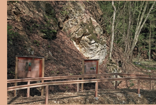
Abbauwand des Kalksteins (Station 9) ▶