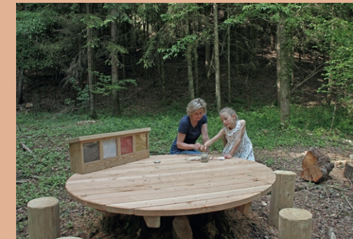
Malen mit Erdfarben ▶