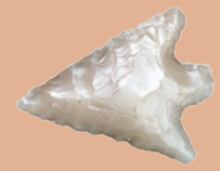
Pfeilspitze aus hellem Feuerstein