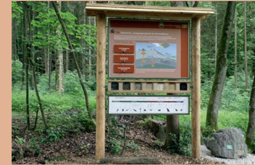
Informationstafel mit interaktiven Elementen (Station 1) ▶