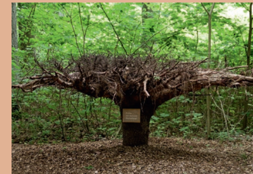
Fichtenwurzelteller mit Flachwurzeln (Station 7) ▶