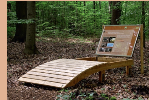
Bodenliege (Station 5) ▶