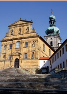
Maria Hilf Kirche aus Eisensandstein erbaut

Herzlich willkommen am Bodenerlebnispfad Amberg auf dem Mariahilfberg!