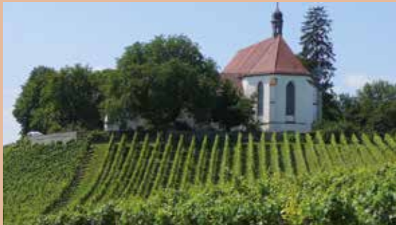
Das Kloster Vogelsburg