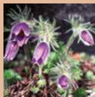
Knabenkraut ( Dactylorhiza majalis ) und Küchenschelle ( Pulsatilla vulgaris )