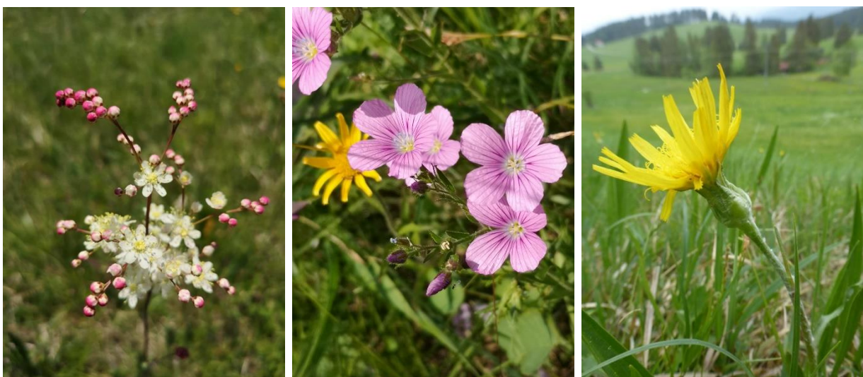
Abbildung 2: Kleines Mädesüß, Klebriger Lein, Niedrige Schwarzwurzel

Wertgebende Schutzgüter im FFH-Gebiet sind die Magerrasen auf den kalkreichen Moränen- und Schotterablagerungen sowie den Drumlinlandschaften und auf den Kämmen und den Flanken der Faltenmolassezüge. Die häufigste Pflanzengesellschaft bildet der Silberdistel-Horstseggenrasen ( Carlino-Caricetum sempervirentis ). Traditionell wurden die Flächen vermutlich im Sommer gemäht, teilweise mit Nachweide.