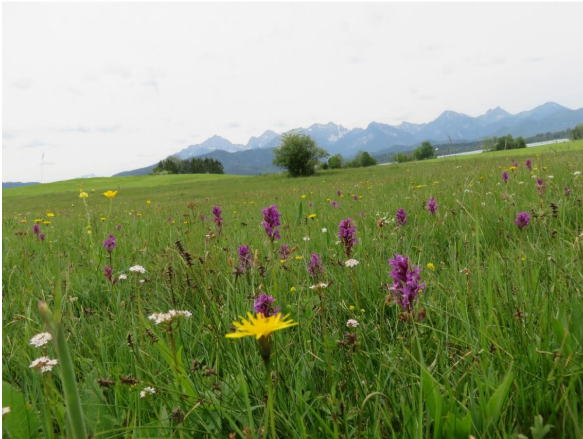
Abbildung 7: Kalkreiches Flachmoor am Langenberg bei Schwangau