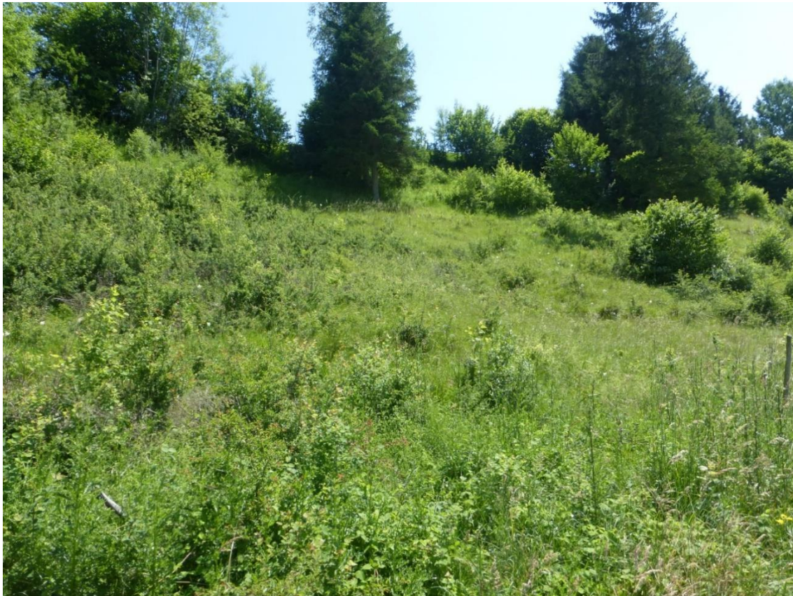
Abbildung 16: Brachliegender Magerrasen an der Mühlberger Halde