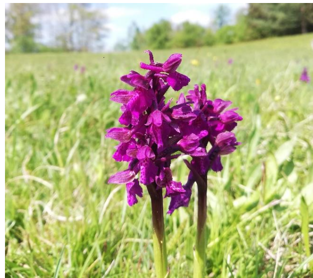
Abbildung 14: Klebriger Lein ( Linum viscosum ), Kleines Knabenkraut ( Orchis morio )

Dazu gehören auch zahlreiche seltene Insektenarten wie das Große Wiesenvögelchen ( Coenonympha tullia ), das Rostbraune Wiesenvögelchen ( Coenonympha glycerion ), der Sumpfwiesen-Perlmutterfalter ( Boloria selene ) oder die Speer-Azurjungfer ( Coenagrion hastulatum ). Zudem wurden auch schützenswerte Vogelarten wie Schwarzstorch, Schwarzkehlchen und Trauerschnäpper nachgewiesen. Bemerkenswert ist ebenfalls das Vorkommen des Storchschnabel-Bläulings ( Polyommatus eumedon ), der seine Eier auf den Blüten des Sumpf-Storchschnabels ablegt.