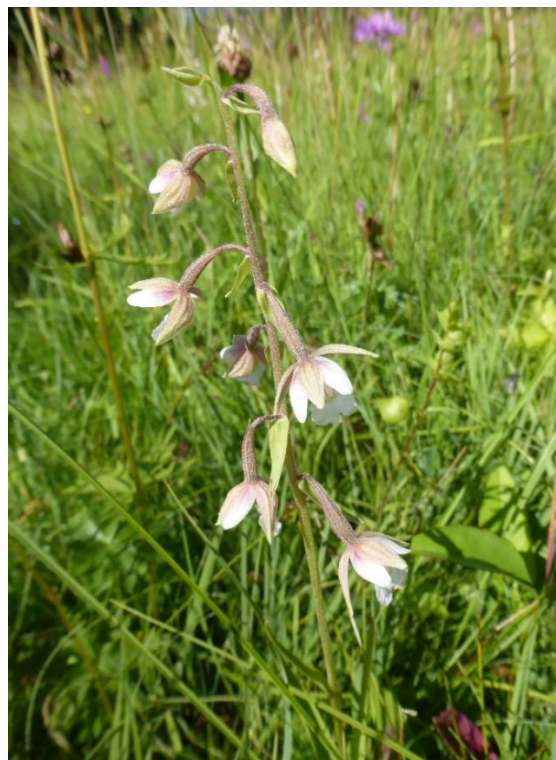
Abbildung 8: Breitblättriges Wollgras und Sumpf-Stendelwurz in Kalkreichem Niedermoor am Ehberg