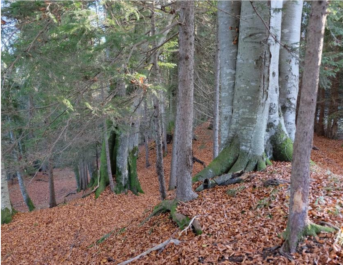
Abbildung 9: Waldmeister-Buchenwald auf dem Buchberg (Foto: A. Walter, AELF Krumbach (Schwaben)-Mindelheim).

Der FFH-LRT 9130 kommt im FFH-Gebiet „Halbtrockenrasen am Foggensee“ hauptsächlich im Norden des Gebietes an der Leite zum Premer Lechsee sowie auf dem Buchberg vor. Sie stocken auf mittel bis gut nährstoffversorgten, mäßig trockenen bis feuchten Böden. Natürlicherweise sind sie von Buchen dominiert und in dieser Höhenlage von Weißtanne und Edellaubhölzern begleitet. Auch die Fichte tritt in der montanen Höhenform als Nebenbauart auf. Die Bodenvegetation bilden Nährstoffzeiger wie Buschwindröschen, Leberblümchen, Goldnessel und Waldsegge.