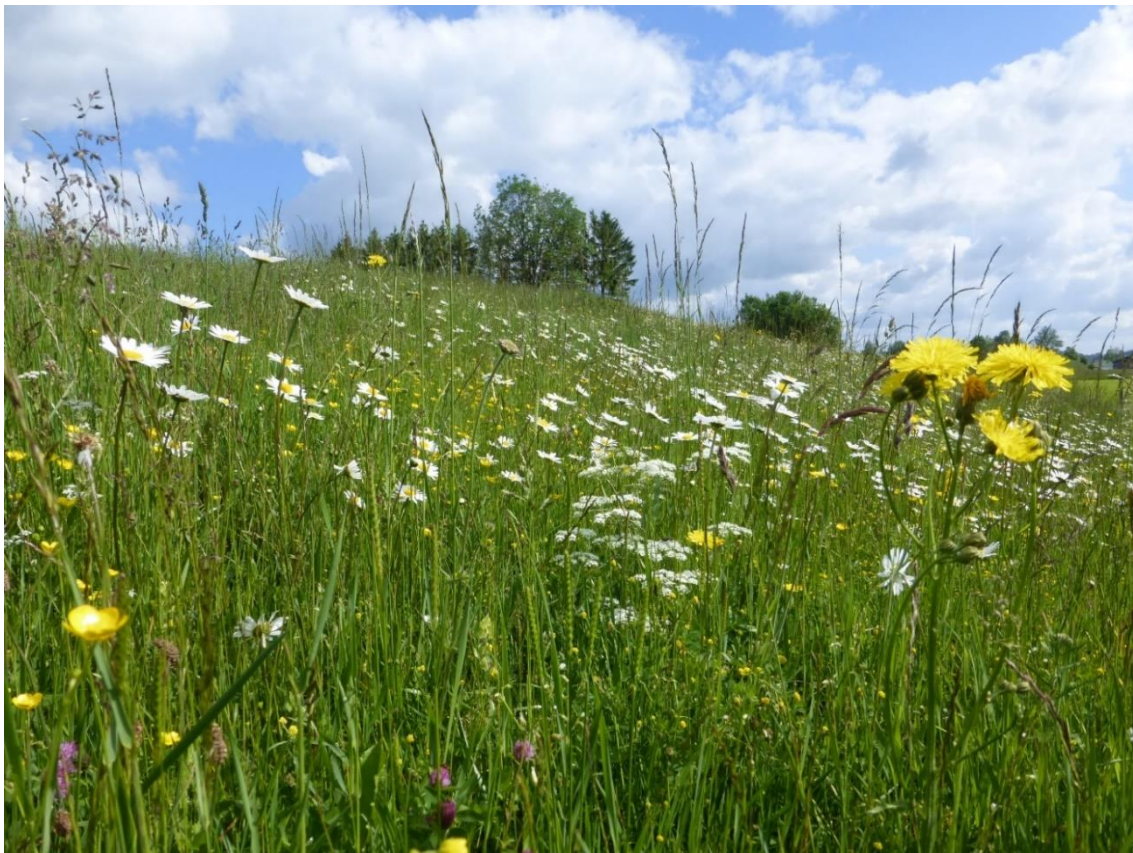
Abbildung 5: Artenreiche magere Flachland-Mähwiese (LRT 6510) am Langenberg

Magere Flachland- oder Berg-Mähwiesen sind ein- bis zweischürige Wiesen, die allenfalls gelegentlich gedüngt werden. Oft werden die Flächen als Mähweiden genutzt, d. h. vor oder nach der Mahd beweidet. Durch stärkere Düngung lassen sich solche Wiesen rasch in grasdominiertes Intensivgrünland überführen. Daher sind diese Wiesen in Mitteleuropa heute sehr selten. Die Lebensraumtypen umfassen im Gebiet artenreiche, durch bunte Wiesenkräuter und Gräser magerer Standorte gekennzeichnete Bestände. Kennzeichnende Arten sind zum Beispiel Margerite, Witwenblume, Kleiner Klappertopf und Wiesen-Bocksbart ( Leucanthemum vulgare , Knautia arvensis , Rhinanthus minor , Tragopogon pratensis ).