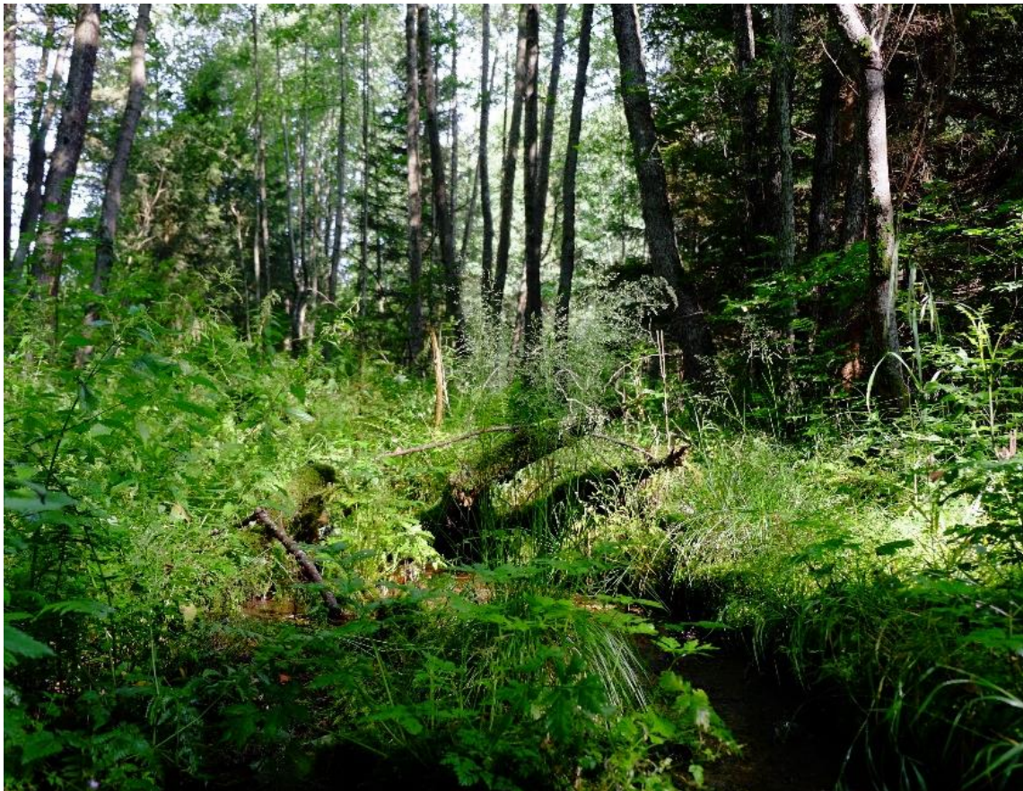
Abbildung 13: Erlen-Eschen-Quellrinnenwald.

Dieser prioritäre Lebensraumtyp kommt im Gebiet hauptsächlich in der Ausprägung als Erlen-Eschen-Quellrinnenwald vor. Er stockt meist kleinflächig an rasch fließenden Bachoberläufen oder auf hängigen Quellfluren mit guter Nährstoffversorgung. Besonders im quellreichen Voralpenland ist er häufig anzutreffen und ist oft auch mit Kalktuffquellen vergesellschaftet. Die Esche ist in tieferen Lagen meist sehr dominant, als Nebenbaumarten treten Grau- und Schwarzerle und Bergahorn auf. In höheren Lagen wird die Esche durch die Grauerle ersetzt.