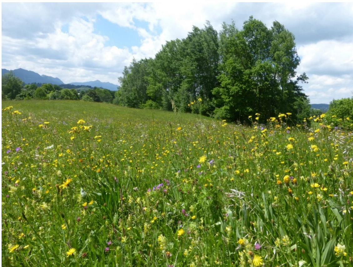
Abbildung 6: Blütenreicher Bestand einer Berg-Mähwiese (LRT 6520) am Ehberg mit Wald-Storchschnabel