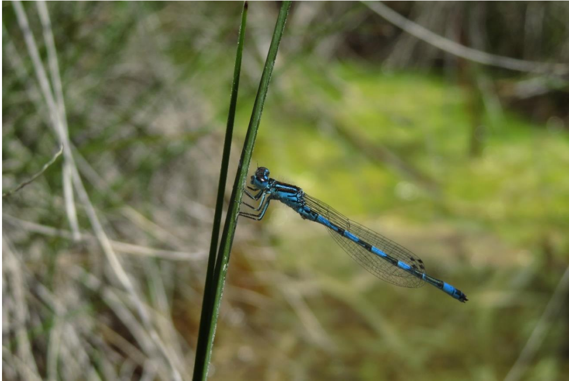
Abbildung 11: Männchen der Helm-Azurjungfer vor veralgtem Quellaustritt.

Biologie: Die Helm-Azurjungfer ( Coenagrion mercuriale ) besiedelt im voralpinen Hügel- und Moorland nahezu ausschließlich Quellschlenken und -rinnale kalkreicher Hangquellmoore im Bereich von Mehlprimel-Kopfbinsenriedern ( Primulo-Schoenetum ). Es handelt sich bei diesen Gewässern meist um kleine, sehr flache Gewässer, welche schwach durchströmt werden. Sie werden in der Regel kaum beschattet und führen ganzjährig Wasser. Aufgrund der geringen Größe der Fortpflanzungsgewässer umfassen Populationen meist deutlich weniger als 100 Imagines (KUHNS und BURBACH 1998 2 ).