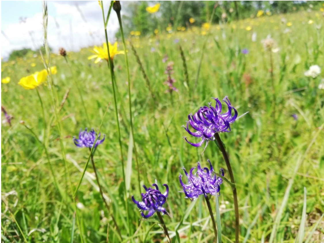
Abbildung 1: Kugelige Teufelskralle in Kalkmagerrasen (LRT 6210) am Ehberg

Wertgebende Schutzgüter im FFH-Gebiet sind die Magerrasen auf den kalkreichen Moränen- und Schotterablagerungen sowie den Drumlinlandschaften und auf den Kämmen und den Flanken der Faltenmolassezüge. Die häufigste Pflanzengesellschaft bildet der Silberdistel-Horstseggenrasen ( Carlino-Caricetum sempervirentis ). Traditionell wurden die Flächen vermutlich im Sommer gemäht, teilweise mit Nachweide.