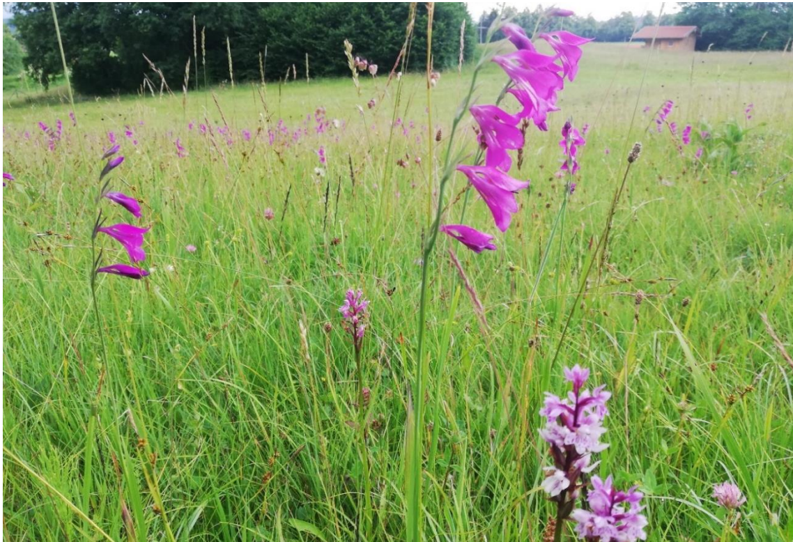
Abbildung 4: Pfeifengraswiese mit einem großen Bestand von Sumpf-Gladiole am Ehberg

Von Pfeifengras dominierte Streuwiesen finden sich im Gebiet nur relativ kleinflächig am Forgensee-Ostufer als Knollendistel-Pfeifengraswiesen im Komplex mit Kalkmagerrasen sowie am Ehberg bei Schwangau im Komplex mit kalkreichem Niedermoor. Charakteristische Arten sind neben dem Pfeifengras z. B. Knollen-Kratzdistel ( Cirsium tuberosum ), Färberscharte ( Serratula tinctoria ), Teufelsabbiss ( Succisa pratensis ) oder Schwalbenwurz-Enzian ( Gentiana asclepiadea ). In den beiden Teilflächen am Ehberg kommt außerdem ein individuenreicher Bestand der Sumpf-Gladiole ( Gladiolus palustris ) vor.