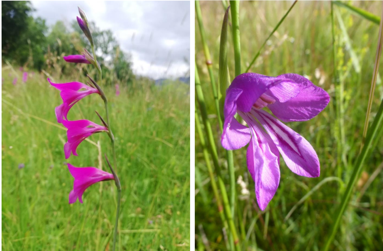
Abbildung 12: Sumpfgladiole mit ganzem Blütenstand und als Detailaufnahme

Die Sumpf-Gladiole besiedelt im Alpenvorland wechselnasse bis wechselfeuchte kalk- und basenreiche, nährstoffarme bis mäßig nährstoffreiche Standorte. Kalkreiche Niedermoore und Knollendistel-Pfeifengraswiesen, aber auch wechselfeuchte Kalkmagerrasen sind typische Lebensräume dieser Art. Ihr bayrisches Verbreitungsgebiet konzentriert sich auf den Füssener Winkel, den unteren und mittleren Lech und den Raum Weilheim und Garmisch-Partenkirchen. Die Art ist in der Roten Liste als stark gefährdet eingestuft. Die Zahl der Vorkommen hat in den letzten 20 Jahren jedoch deutlich zugenommen. Für den Erhalt trägt Bayern eine besondere Verantwortung.