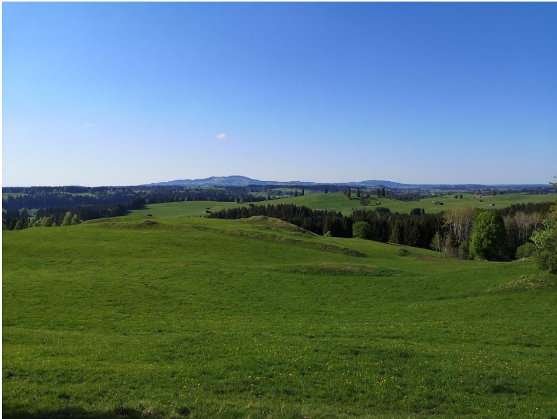
Abbildung 15: Magerrasenreste auf den Härtlingsrücken am Eschenberg