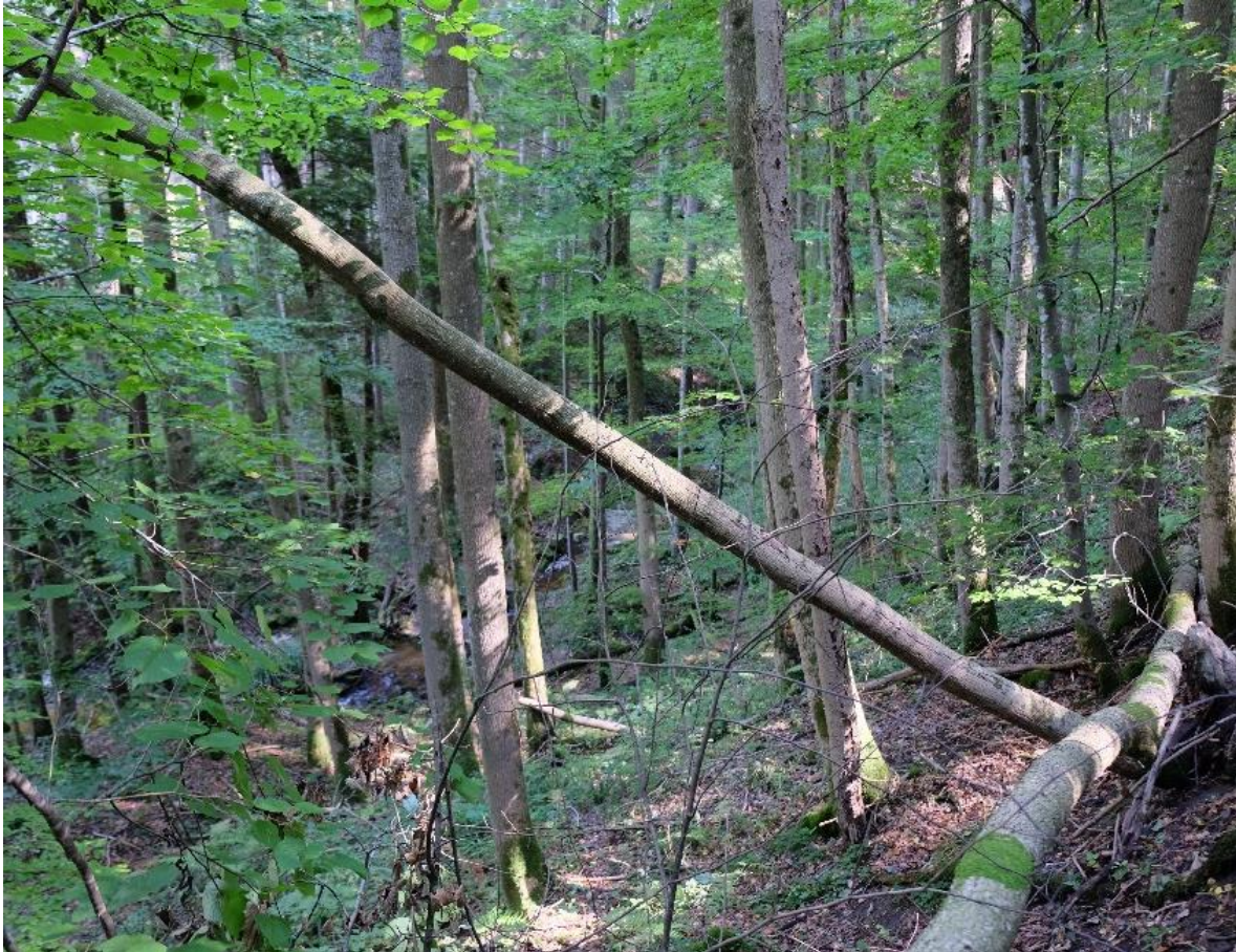
Abbildung 10: Giersch-Ahorn-Eschenwald.

Der FFH-LRT 9180* kommt im FFH- Gebiet „Halbtrockenrasen am Förgensee“ in der Ausprägung als Giersch-Ahorn-Eschenwald vor. Die zwei Flächen liegen einerseits südöstlich Rieden am Einhang zum Förgensee, zum anderen an der Leite des Premer Lechsees. Die Böden sind geprägt durch Nährstoffreichtum, Bodenfrische und die daraus resultierend üppige, hochstaudenreiche Bodenvegetation. Auch Quellaustritte sind nicht selten. Hauptbaumarten sind Esche und Bergahorn, begleitet von Bergulme, Linde und Spitzahorn. Geringer beteiligt sind Tannen und Buchen