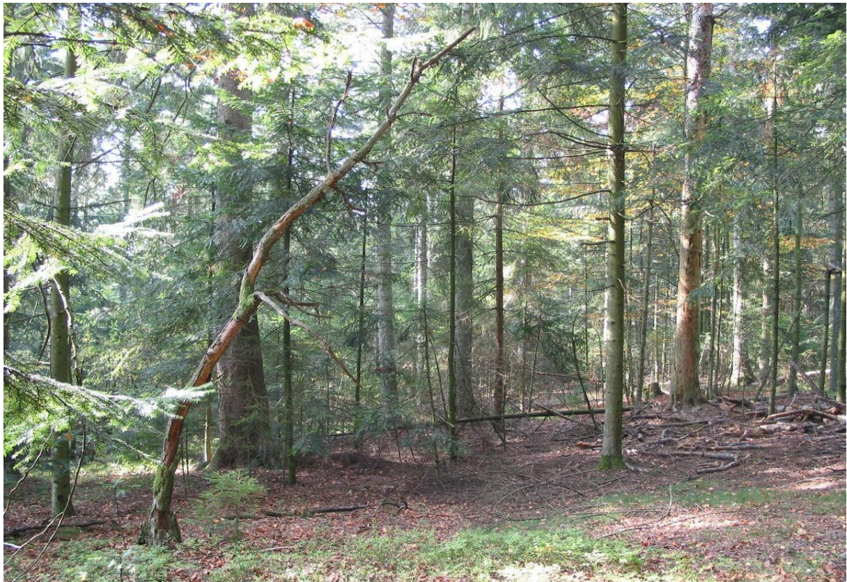
Foto 13: Tannen- und totholzreicher Aspekt des Hainsimsen-Buchens im FFH-Gebiet