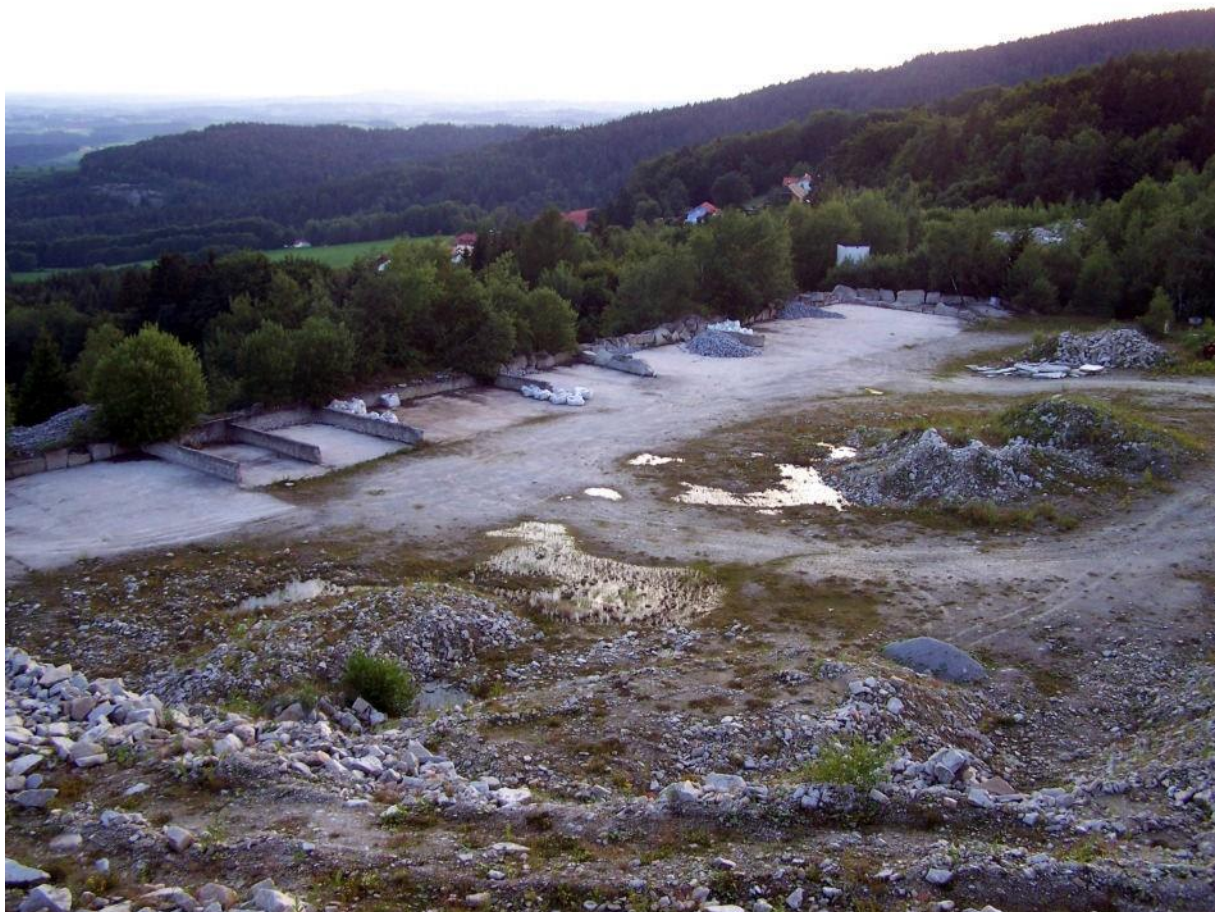
Foto 5: Übersicht von der großen Halde aus, Blickrichtung nach Südwesten

In südlichen und östlichen Teil des FFH-Gebietes befinden sich große, planierte und z. T. sogar betonierte Lagerflächen. Besonders die große Lagerfläche im Süden ist für die Gelbbauchunke attraktiv. Die Fläche ist weitgehend eben, ganz leicht nach Süden geneigt. Im Osten grenzt eine sehr große, ca. 10 m hohe Gesteinsschutthalde an. Auf der planierten Fläche befinden sich weitere, kleinere Schuttberge.