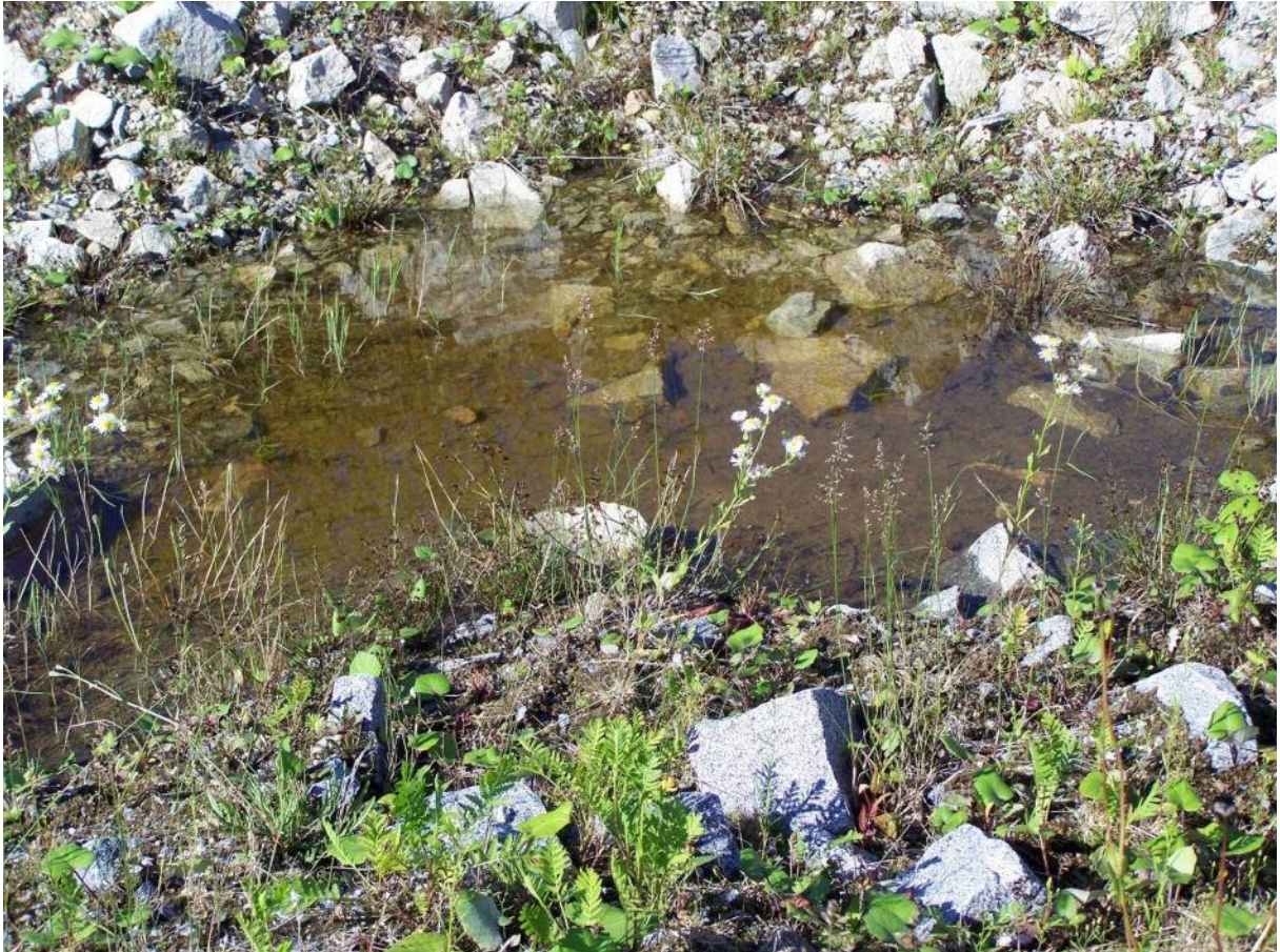
Foto 8: Pfütze Nr. 2 am Fuß der großen Halde, südlicher, tiefer Teil.

Der südliche Teil ist mit bis zu 20 cm deutlich tiefer als der nördliche, ausgedehntere Teil. Dieser wohl sehr dauerhafte Bereich der Pfütze maß zum Kartierzeitpunkt ca. 2 m x 4 m. Ein völliges Austrocknen dieses Bereiches erscheint unwahrscheinlich.