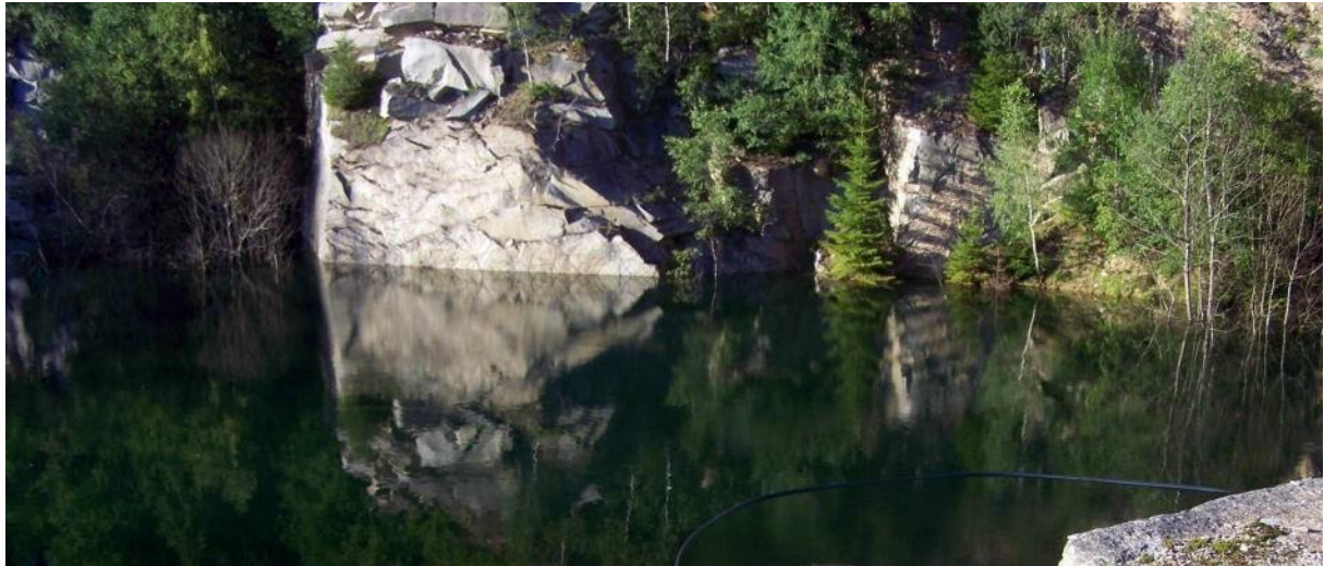
Foto 4: Der Steinbruchsee. Anhand der Gehölze in der Steilwand kann man den Anstieg des Wasserspiegels in letzter Zeit gut nachvollziehen.

Die Kartierungen 2007 bestätigten das Vorhandensein von Gelbbauchunken im FFH-Gebiet, allerdings in deutlich geringerer Anzahl als 2001 und 2003.