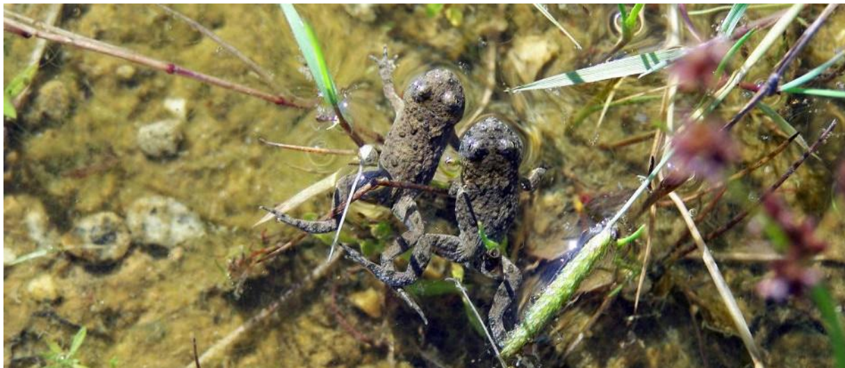
Foto 3: Diesjährige Jungtiere der Gelbbauchunke (Hüpfertlinge) in Pfütze Nr. 3

Meldegrund für Natura 2000 war das Vorkommen der Gelbbauchunke (Anhang II der FFH-Richtlinie). Vorkommen der Art waren durch Untersuchungen aus den Jahren 2001 und 2003 bekannt: 2001 wurde die Gelbbauchunke in großer Anzahl festgestellt.