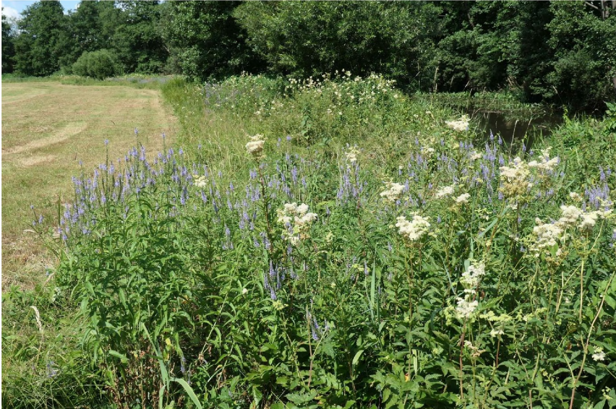
Abb. 4: Feuchte Hochstaudenflur bei Schönthal mit Mädesüß ( Filipendula ulmaria ) und Blauweiderich ( Veronica maritima ).

Dem LRT 6430 werden feuchte Hochstaudensäume im Flachland und in den Mittelgebirgen zugeordnet, wenn sie an Ufern von Gewässern oder an Waldrändern (Waldinnen- und Waldaußensäumen) gelegen sind, von wo aus sie sich flächig ausdehnen können. Sie können sekundär als Sukzessionsstadium brachliegender Nasswiesen oder an Stelle von Großseggen- und Röhricht-Gesellschaften nach Grundwasserabsenkung auftreten. Der LRT zeichnet sich durch die Dominanz von nässe- und feuchtezeigenden Hochstauden aus. Als wichtigste Arten sind Mädesüß ( Filipendula ulmaria ), Gemeiner Gilbweiderich ( Lysimachia vulgaris ), Rauhaariger Kälberkropf ( Chaerophyllum hirsutum ) und Blutweiderich ( Lythrum salicaria ) zu nennen. Fluren mit Dominanz von Nährstoffzeigern (Nitrophyten) oder gebietsfremden Arten (Neophyten) sowie lineare Hochstaudenfluren an Entwässerungsgräben gehören nicht zum LRT. Der LRT steht unter dem Schutz des §30 BNatSchG (LFU 2018 b, d).