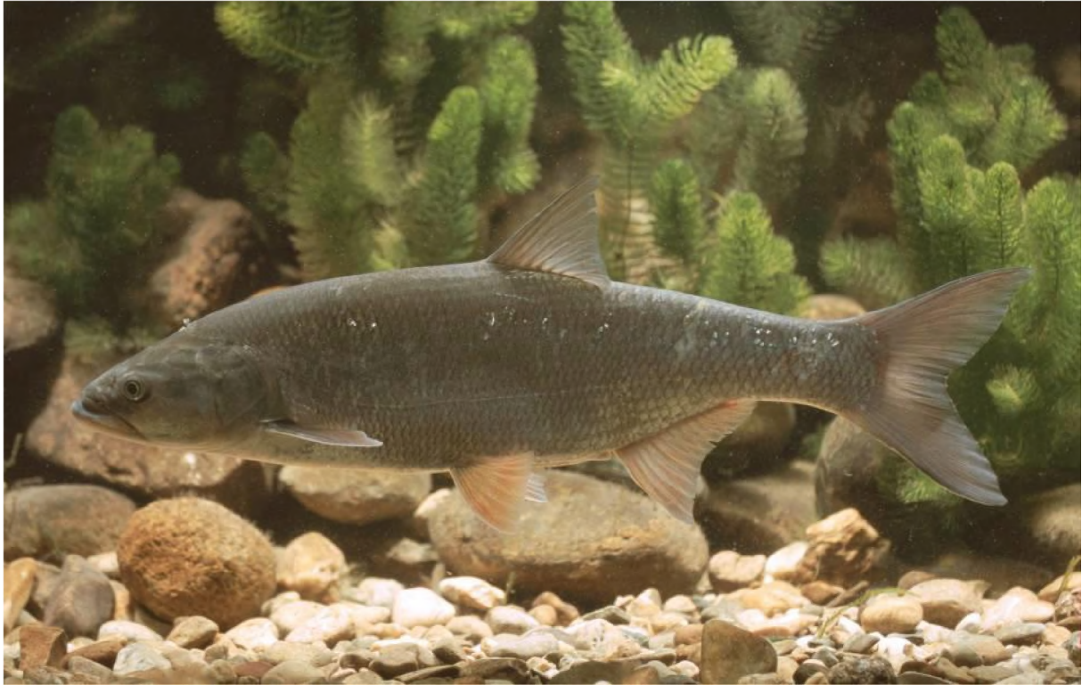
Abb. 15: Rapfen (Schied) (Foto: A. Hartl; LFU 2012e).

Der Rapfen oder Schied erreicht meist eine Länge von 50 bis 70 cm, in Ausnahmefällen auch 1,20 m. Er ist der einzige europäische Karpfenfisch, der sich ausschließlich räuberisch ernährt. Er bewohnt bevorzugt strömungsreiche Fließgewässerabschnitte, kommt aber auch in Seen und sogar im Brackwasser der Ostsee vor. In seiner Jugend lebt der Schied gesellig in Oberflächennähe, wo er sich von Kleintieren aller Art ernährt. Mit zunehmendem Alter geht er zu einer einzelgängerischen Lebensweise über und ernährt sich vorwiegend von Fischen. In diesem Stadium bewohnt er die uferfernen Freiwasserzonen der Gewässer. Der Schied kommt in den Flusssystemen des Rheins, der Donau und der Elbe in größeren Seen und Flüssen vor (LFU 2012e).