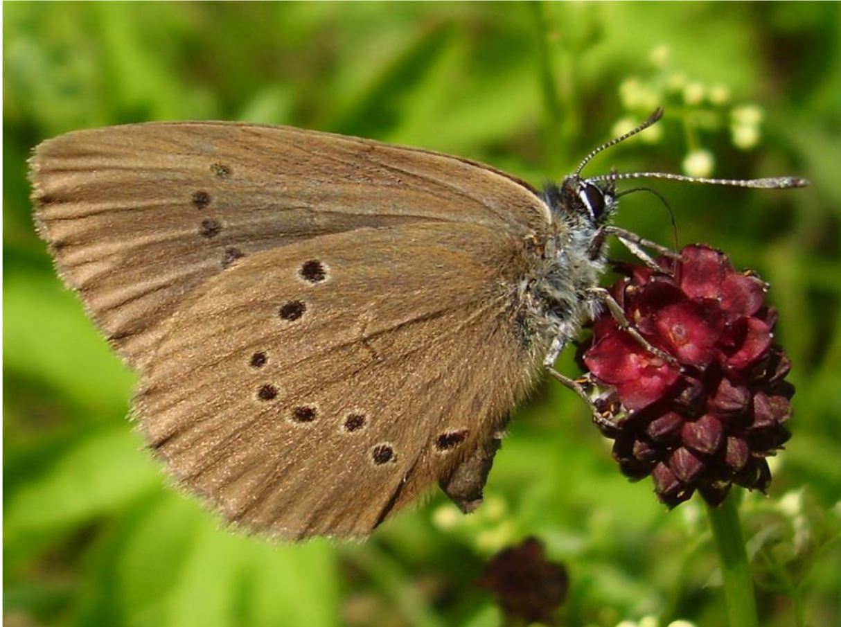
Abb. 14: Dunkler Wiesenknopf-Ameisenbläuling auf einer Blüte des Großen Wiesenknopfs.

Der Dunkle Wiesenknopf-Ameisenbläuling ( Phengaris [Maculinea] nausithous ) besiedelt Feuchtwiesen, Streuwiesen, Hochstaudenfluren, Gewässerufer, Böschungen und andere Saumstandorte mit Vorkommen des Großen Wiesenknopfs ( Sanguisorba officinalis ) sowie Nestern der Wirtsameise Myrmica rubra (= M. laevinodis ). Die Falter fliegen im Juli und August. Die Eier werden an großen, endständigen, noch geschlossenen Blütenköpfen des Großen Wiesenknopfs abgelegt, wo die Larve die ersten drei Stadien verbringt. Nach dem 3. Larvalstadium lässt sie sich auf den Boden fallen, wo sie nach Abgabe von Duftstoffen (sogenannte Pheromon-Mimese) von Ameisen in ihre Nester getragen wird. In den Ameisennestern entwickelt sich die Larve bis zum Sommer des nächsten Jahres weiter (LFU 2012c).