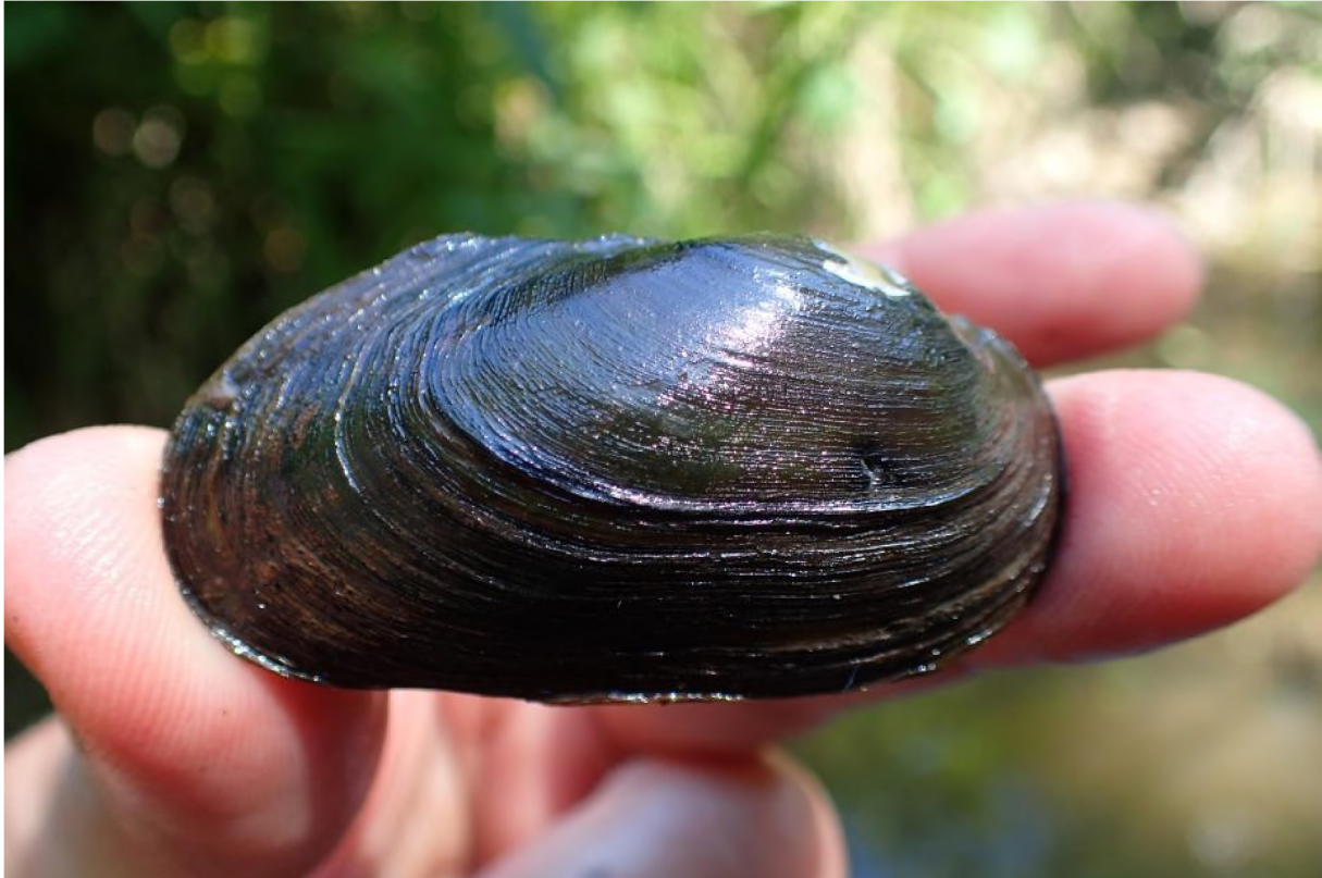
Abb. 12: Bachmuschel aus der Böhmischem Schwarzwach.

Bachmuscheln werden 5 bis 6 Zentimeter groß mit meist recht dicken, gelbgrün bis braun gefärbten Schalen mit einer etwas ovalen Form. Sie erreichen in Bayern ein Alter zwischen 20 und 30 Jahren.