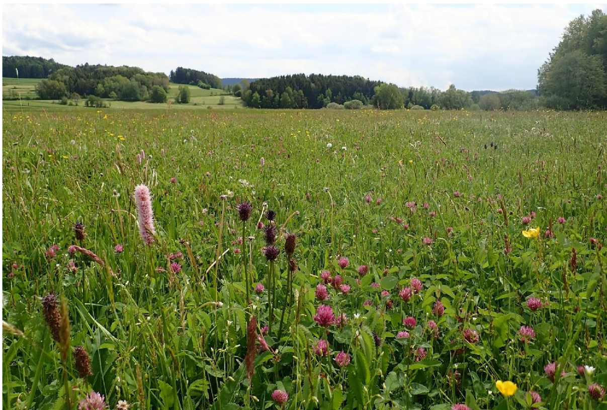
Abb. 5: Artenreiche Flachland-Mähwiese mit Schwarzer Teufelskralle ( Phyteuma nigrum ), Wiesen-Knöterich ( Bistorta officinalis ) und viel Rot-Klee ( Trifolium pratense ) bei Albernhof.

Der LRT 6510 umfasst die artenreichen Mähwiesen auf mittleren Standorten im Flach- und Hügelland, also Mähwiesen auf frischen bis mäßig trockenen Böden. Sie gehören zu den Glattthaferwiesen (Verband Arrhenatherion ) und weisen typische Wiesen-Kennarten auf. Neben Glattthafer ( Arrhenatherum elatius ) gehören Wiesen-Glockenblume ( Campanula patula ), Wiesen-Flockenblume ( Centaurea jacea ), Wiesen-Pippau ( Crepis biennis ), Wiesen-Labkraut ( Galium album ), Acker-Witwenblume ( Knautia arvensis ) und Wiesen-Bocksbart ( Tragopogon pratensis ) zu den Kennarten. Die Flachland-Mähwiesen zeichnen sich durch einen hohen Krautanteil aus, der meist einen „blumenbunten“ Aspekt bewirkt und sind i. d. R. auch anhand ihrer lockeren, mehrschichtigen Bestandsstruktur von intensiv genutzten Wirtschaftswiesen zu unterscheiden. Hochwachsende, ertragsreiche Obergräser treten meist zurück oder fehlen ganz. Die Mähwiesen können extensiv bis mäßig intensiv landwirtschaftlich genutzt sein. Damit keine zu nährstoffreichen, wüchsigen Wiesen erfasst werden, müssen Nährstoffzeiger (Nitrophyten) einen Deckungsgrad von weniger als einem Viertel aufweisen. Idealerweise sollten