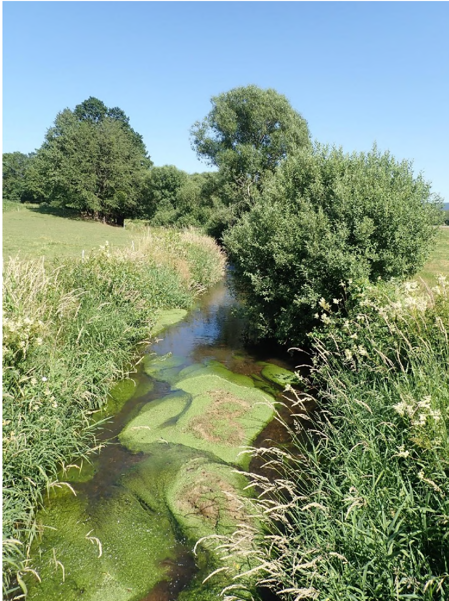
Abb. 3: Böhmisches Schwarzach bei Hocha mit Gewässervegetation aus Haken-Wasserstern ( Callitriche hamulata ).