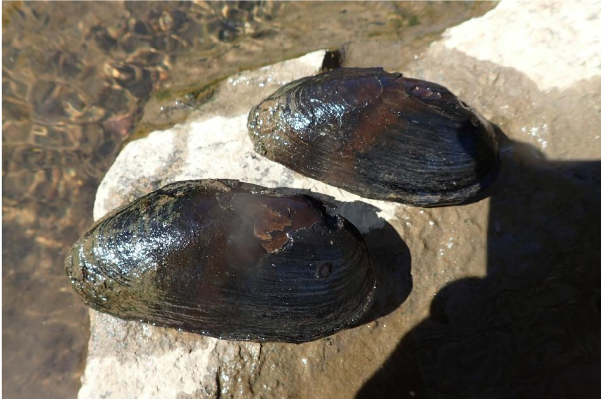
Abb. 9: Lebende Flussperlmuscheln aus der Böhmischem Schwarzach im Alter zwischen etwa 50 (oben) und 70-80 Jahren (unten) (Foto: C. Schmidt, April 2019).

Die Flussperlmuschel wird bis zu 15 Zentimeter lang und besitzt eine dickwandige, manchmal leicht nierenförmige, fast schwarze Schale. Ihren Namen hat sie von der Eigenschaft, in die Muschel eingedrungene Fremdkörper durch Anlagerung von Kalk zu "isolieren" - so entstehen Perlen. Allerdings enthält nur ein Bruchteil der Tiere solche Einschlüsse. Flussperlmuscheln besiedeln nährstoffarme, schnell fließende, kalkarme und sauerstoffreiche Bäche und Flüsse.