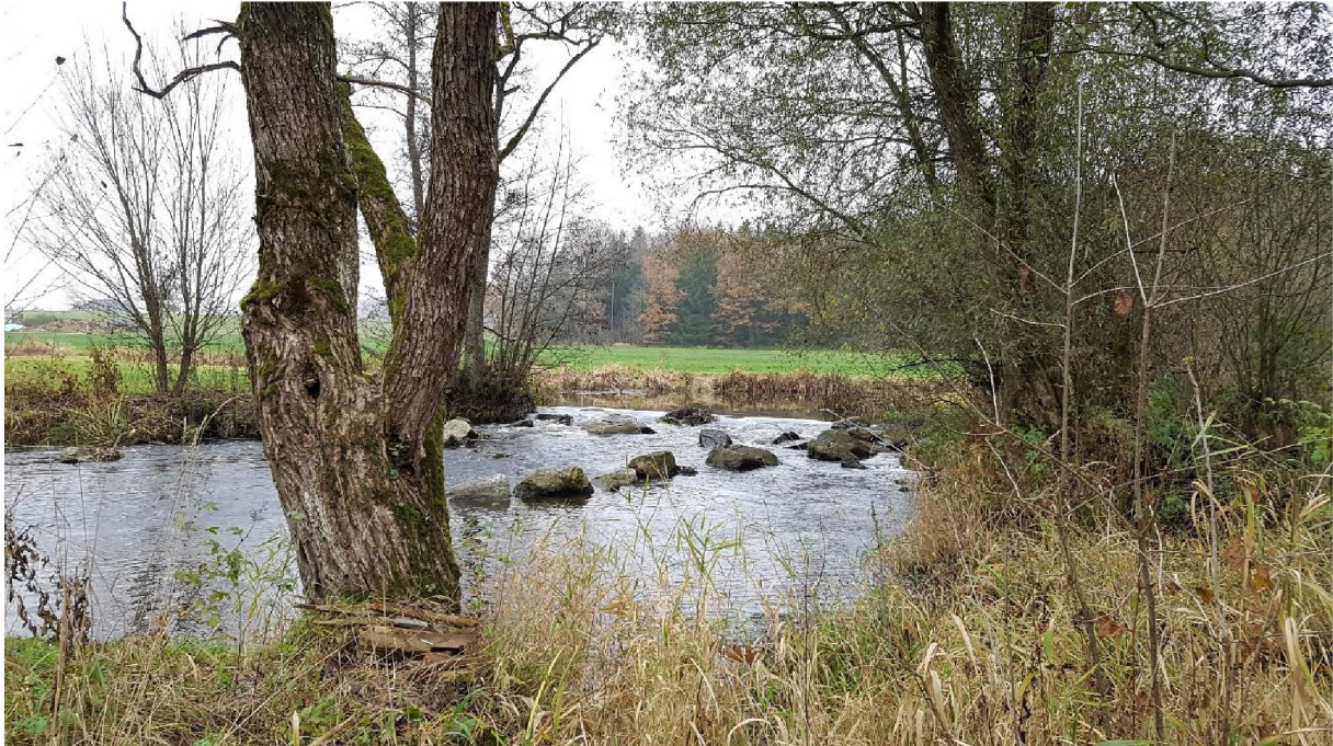
Abb. 8: Bruchweiden-Auwald an der Schwarzach

Der Bruchweiden-Auwald begleitet die kleineren Flüsse mit kalkarmen Schottern. Die von Bruchweide dominierte Pioniergesellschaft wächst nur wenig über dem Mittelwasserstand am Flussufer, auf Inseln, an Altwasserarmen und Überflutungsrinnen und wird bei jedem Hochwasser überschwemmt. Dazu gesellen sich Schwarzerlen, Pappeln und Weidengebüsche mit Purpur-, Korb- und Mandelweide.