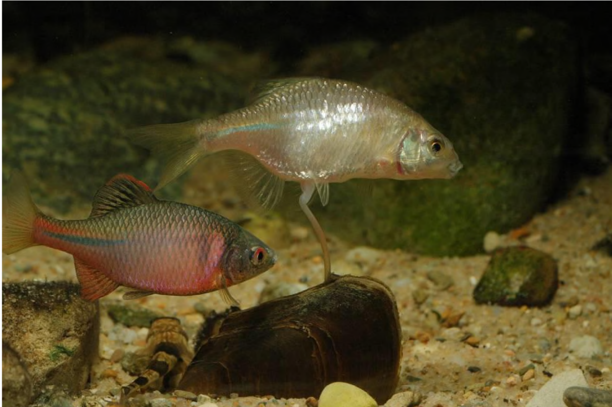
Abb. 16: Bitterlinge bei der Eiablage (Foto: A. Hartl; LFU 2012e).

Der Bitterling gehört zu den kleinsten europäischen Karpfenfischen und wird in der Regel nur 5 bis 6 cm lang, in seltenen Fällen erreicht er auch 9 cm. Der Fisch lebt gesellig in flachen, stehenden oder langsam fließenden, sommerwarmen Gewässern mit Pflanzenwuchs, wie beispielsweise in Altarmen oder verkrauteten Weihern. Er bevorzugt sandige Bodenverhältnisse mit einer Mulmauflage und meidet tiefgründige, verschlammte Gewässer. Der Bitterling ernährt sich von Algen und weichen Pflanzenteilen, aber auch von Kleintieren. Seine Fortpflanzung ist hochgradig spezialisiert: Zur Laichzeit zwischen April und Juni bei Wassertemperaturen von mehr als 17°C lockt das Männchen ein Weibchen zu einer Flussmuschel ( Unio spec. ) oder Teichmuschel ( Anodonta spec. ), in deren Afteröffnung das Weibchen mit einer langen Lege- röhre jeweils mehrere Eier einführt. Unmittelbar darauf gibt das Männchen seine Spermien ab, die über das Atemwasser der Muschel ins Innere gelangen und dort die Eier befruchten. Dieser Vorgang wird mehrfach an verschiedenen Muscheln wiederholt. Die befruchteten Eier entwickeln sich dann innerhalb der Muschel zu schwimmfähigen Jungfischen, die die Muschel verlassen (LFU 2012e).