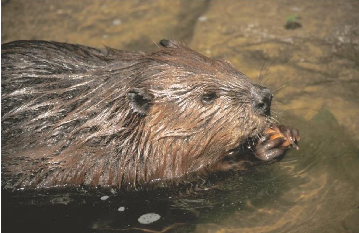
Abb. 10: Biber ( Castor fiber ) (Quelle: Robert Groß).

Biber gehören zur Ordnung der Nagetiere mit einer Gesamtlänge von bis zu 135 cm und einem Gewicht von 25 bis 30 kg, ausnahmsweise etwas schwerer. (ZAHNER et al. 2005). Auffallend ist der abgeflachte, beschuppte Schwanz.