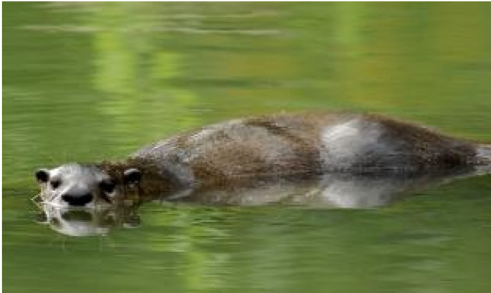
Abb. 11: Fischotter (Foto: R. Kaminski, LfU).

Der Lebensraum des Fischotters als „Wassermarder“ besteht aus dem Ufersaum von Fließgewässern und dem Gewässer selbst. Er bewohnt Höhlungen im Uferbereich, deren Ausgang in der Regel unter Wasser liegt. Er bevorzugt Flüsse mit struktur-, gehölz- und deckungsreichen Ufern. Sein hoher Nahrungsbedarf (ca. 1 kg Fisch/Fleisch pro Nacht) erfordert eine hohe Dichte an Beutetieren, neben Fischen auch Bisam, Wanderratte und Schermaus, Amphibien sowie Krebse. Die Tiere sind territorial. Die Reviergröße ist abhängig von der Lebensraumqualität und vom Nahrungsangebot und kann 20 bis zu 40 km Gewässerlauf betragen. (STMELF 2013). Im Bayerischen Wald liegt die Reviergröße zwischen 20 km an Haupt- und 60 km an Nebengewässern. Männliche Fischotter können bis zu 35 km Strecke in einer Nacht zurücklegen (dto.). Ihre Wanderungen sind dabei nicht ausschließlich an Gewässer gebunden. Die Hauptgefährdung des Fischotters liegt in der zunehmenden Zerschneidung und Zerstörung von noch großräumig naturnahen Fließgewässern und ihren Auen.