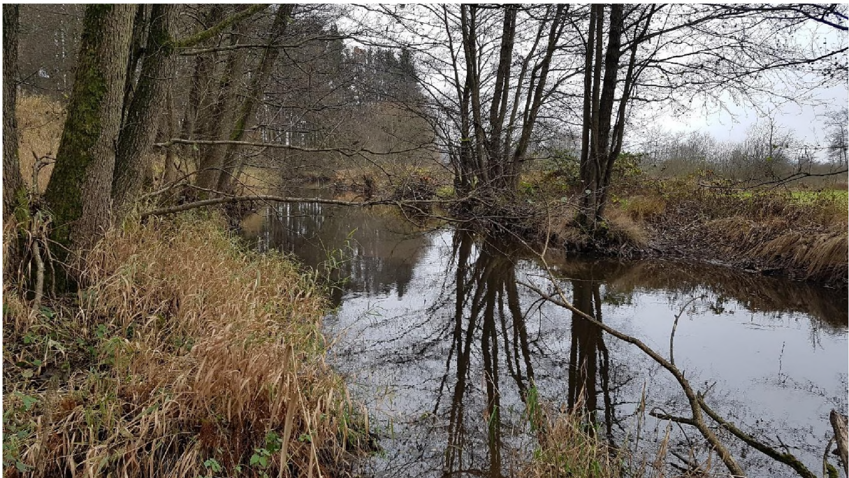
Abb. 7: Waldsternmieren-Schwarzerlen-Bachauenwald an der Schwarzach

Der Waldsternmieren-Schwarzerlen-Bachauenwald findet sich als uferbegleitender Auwald entlang rasch fließender Bäche in Silikatgebieten. In Wiesentälern ist er meist als schmaler Galeriewald ausgeformt. Die Schwarzerle ist die dominierende Baumart. Dazu beteiligen sich Bruchweide, Esche, Stieleiche und Traubenkirsche.