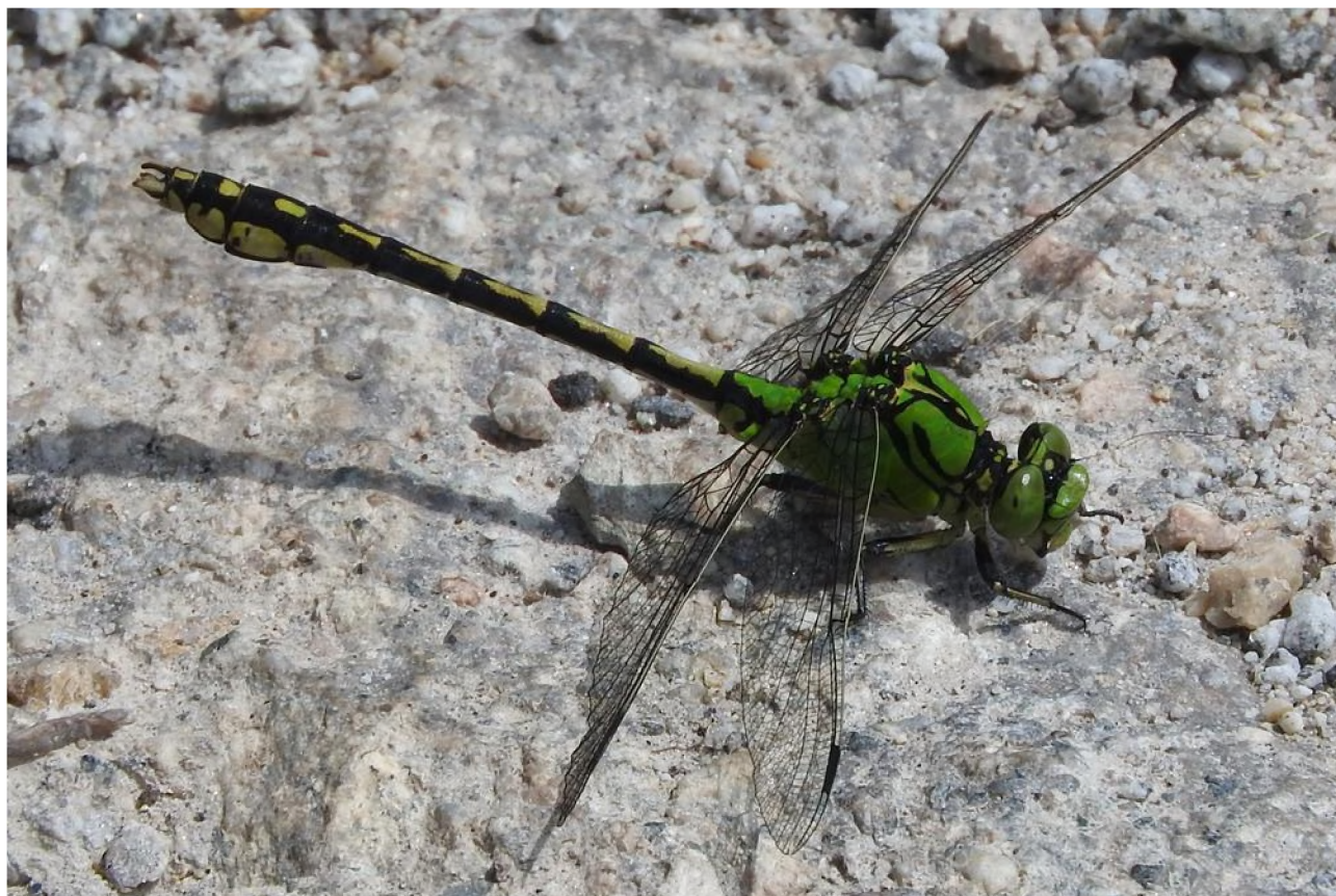
Abb. 13: Grüne Keiljungfer