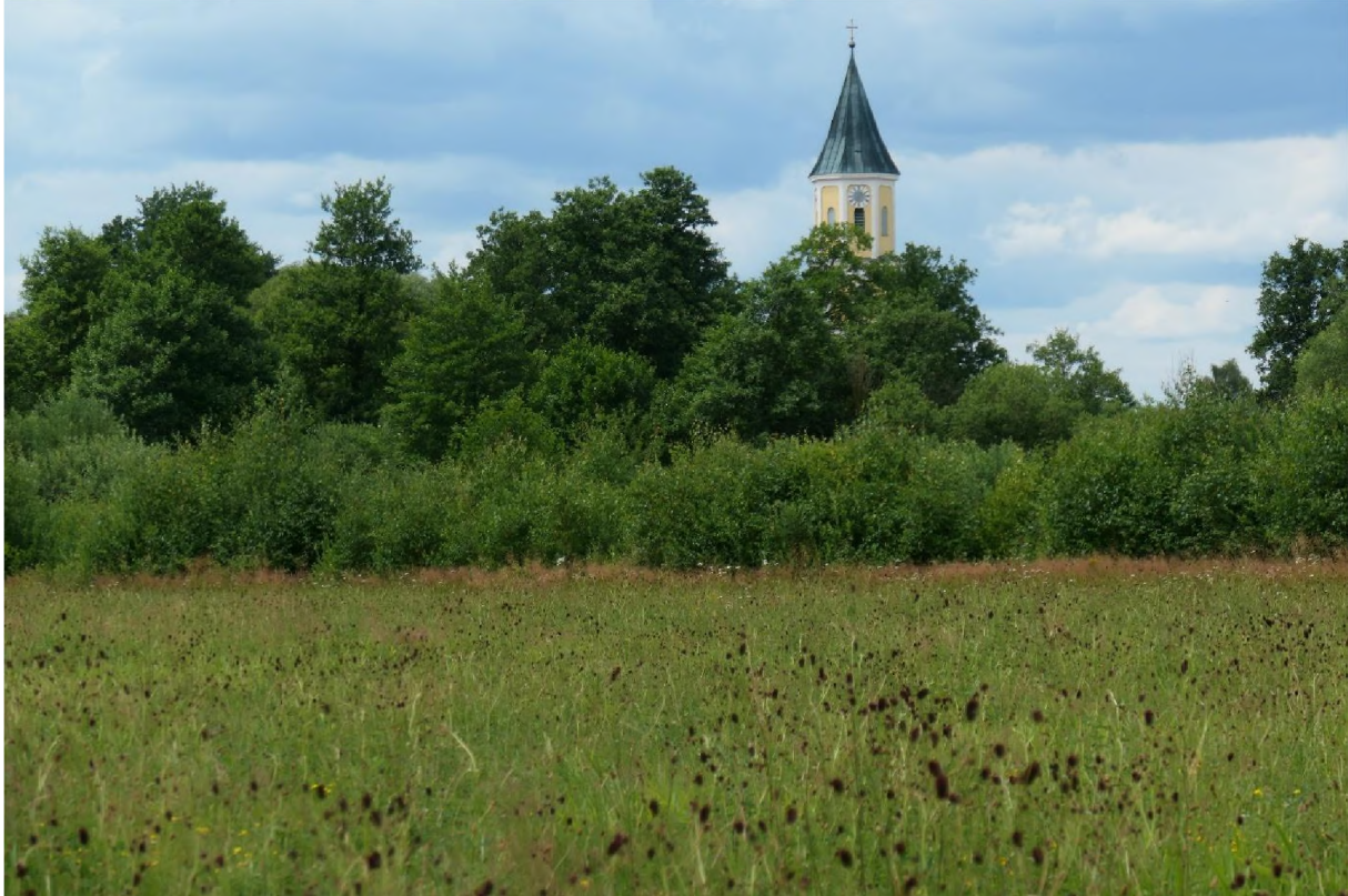
Abb. 1: Schwarzachau im FFH-Gebiet 6641-371 bei Schönthal.

Das FFH-Gebiet „Schwarzachtal zwischen Hocha und Schönthal“ schließt auf über 11 km Länge weite Bereiche des Talraums im Fließgewässersystem der Schwarzach ein, die überwiegend als Grünland genutzt werden. Das FFH-Gebiet zieht sich im Tal der Böhmisches Schwarzach unterhalb des Persee-Staudamms bei Waldmünchen nach Westen und schwenkt nach der Einmündung der beiden Seitenbäche Biberbach und Streitbach nach Süden. Nördlich von Kritzenast mündet von Westen her die Bayerische Schwarzach ein und vereinigt sich mit der Böhmisches Schwarzach zur Schwarzach. Vor Tharau schwenkt die Schwarzach wieder nach Westen. An der B22 bei Schönthal liegt das Südwestende des FFH-Gebiets.