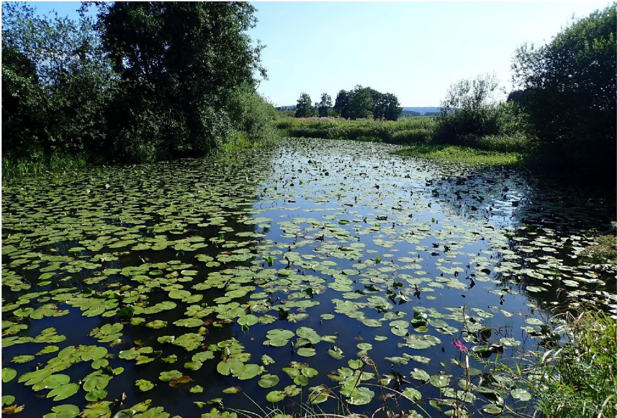
Abb. 6: Altwasser südöstlich von Kritzenast mit Gelber Teichrose ( Nuphar lutea ).

Stillgewässer aller Größen, vom Tümpel über Fischteiche bis hin zum See sowie Altwasser und nicht oder unwesentlich durchströmte Altarme sind dem LRT 3150 zuzuordnen, wenn in ausreichendem Maße eine auf nährstoffreiches Wasser hinweisende Schwimmblatt- oder Unterwasservegetation ausgebildet ist. Typischerweise sind See- oder Teichrosen ( Nymphaea alba , Nuphar lutea ) und Laichkrautarten ( Potamogeton spp.) am Aufbau der Gewässervegetation beteiligt. Röhrichte und Seggensäume im Wechselwasserbereich zählen zum LRT mit dazu. Die Stillgewässer des LRT 3150 sind meist ungenutzt bis (im Falle von Fischteichen) mäßig intensiv genutzt. Der LRT steht in naturnahen Stillgewässern unter dem Schutz des §30 BNatSchG (LFU 2018 b, d).