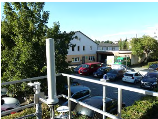
Stationsumgebung Blickrichtung Süd (Aufnahme: August 2018)