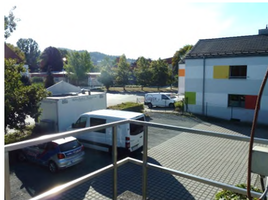
Stationsumgebung Blickrichtung Ost (Aufnahme: August 2018)