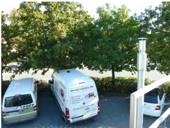
Stationsumgebung Blickrichtung Nord (Aufnahme: August 2018)

© Daten: Bayerische Vermessungsverwaltung, EuroGeographics