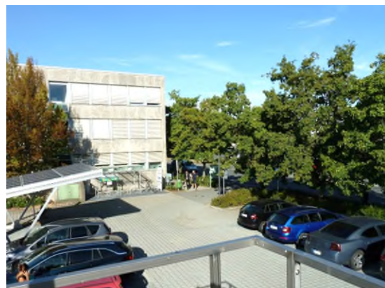
Stationsumgebung Blickrichtung West (Aufnahme: August 2018)