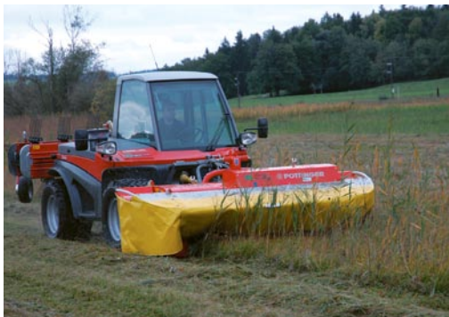
Kreiselmäherwerke erlauben eine hohe Geschwindigkeit und damit verbunden eine hohe Flächenleistung. Allerdings gefährden sie in hohem Maße Kleintiere. Insbesondere wenn Knicker eingesetzt werden, haben Tiere keine Überlebenschance.