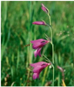
Die Sumpf-Gladiole wird in der Fauna-Flora-Habitat-Richtlinie der europäischen Union genannt. Ihr weltweiter Schwerpunkt ist auf bayerischen Streuwiesen.