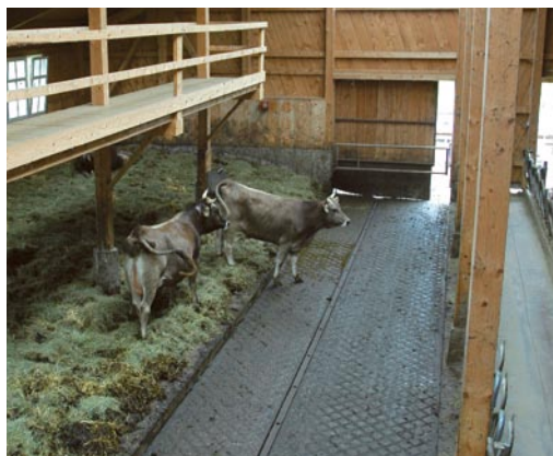
Für die Verwertung von größeren Mengen Streu sind Stallsysteme mit Festmistgewinnung (hier ein Tretmiststall) am besten geeignet.

Manche Betriebsleiter verwenden im Kälberstall keine Streu. Sie befürchten, dass die Streu Nabelentzündungen begünstigt. Es gibt jedoch viele Bauern, die Streu auch im Kälberbereich ohne Probleme einsetzen. Vermutlich ist die Qualität der Streu diesbezüglich ausschlaggebend.