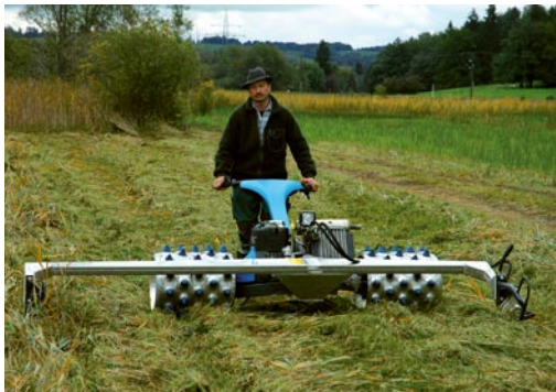
Einachsmähbalken mit Eisenrädern lassen sich auch sehr gut auf steilen Flächen einsetzen.

Brachgefallene Streuwiesen wachsen recht schnell mit Gehölzen zu (z.B. Faulbaum, Fichte, Weide). Derartige Streu ist nicht zu verwerten. Zur Gewinnung von hochwertigem Streumaterial sind Streuwiesen im Abstand von ein oder maximal zwei Jahren zu mähen. Um auf wiederhergestellten Streuwiesen einen angemessenen Nährstoffzug sicherzustellen, müssen diese vorab meist mehrmals pro Jahr gemäht werden. Hat sich hernach eine stabile Streuwiesenvegetation etabliert, kann die Häufigkeit der Mahd reduziert und der Zeitpunkt der Mahd später erfolgen.