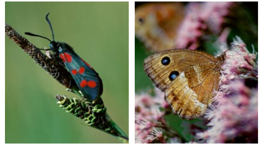
Links: Zu den typischen Streuwiesenarten zählen verschiedene Riedgräser und Widderchen. Rechts: Die großen blauen Augenflecken sind charakteristisch für den Riedteufel.

amtes für Umwelt, dass Vorkommen zahlreicher sehr seltener Schmetterlingsarten in Bayern nur noch auf Streuwiesen zu finden sind, so z.B. der Riedteufel, ein brauner Falter mit blauen Augenflecken, der dem Projekt seinen Namen gab.