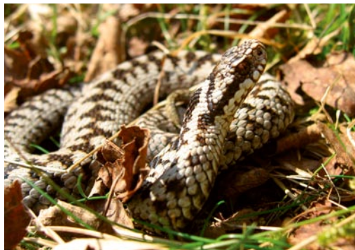
Die tag- und dämmerungsaktive Kreuzotter bevorzugt natürliche oder extensiv genutzte Lebensräume. Die Kreuzotter kommt vorwiegend in [kälteren] Lebensräumen vor und bringt aus diesem Grund lebende Junge zur Welt.

Die Tierarten der Streuwiesen sind an ein Leben unter feuchten Bedingungen angepasst: