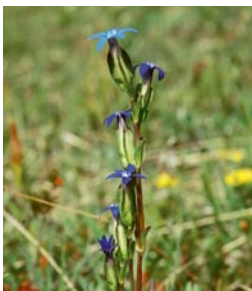
Der Schlauch-Enzian ist im Alpenvorland sehr stark zurückgegangen. Für diese Art hat Bayern eine weltweite Erhaltungsverantwortung.