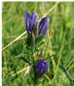
Ab August dienen die Blüten des Lungen-Enzians den Larven des Lungenenzian-Ameisenbläuling (Schmetterling) als einzige Nahrungsquelle, bevor sie sich in die Nester ihrer Wirtameisen eintragen lassen und von diesen füttern lassen. Zu frühe Mahd gefährdet den Lungen-Enzian und den Lungenenzian-Ameisenbläuling.