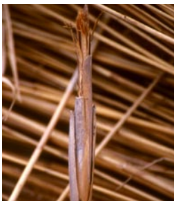
Durch die Eiablage der Fliegenart Liparia lucens entwickeln sich an Schilfstängeln dicke Wucherungen, die von verschiedenen Insekten zur Aufzucht der Larven genutzt werden.

Streuwiesen zeichnen sich durch eine hohe Vielfalt an Pflanzen und Tieren aus. Neben interessanten Gewächsen mit Namen wie Herzblatt, Blutwurz, Wollgras und Fieberschmalz sind auch bundesweit seltene Pflanzenarten zu finden. Dazu gehören sehr kleinwüchsige Pflanzen, die nur in Streuwiesen genug Sonne bekommen, in denen hochwüchsige Vegetation fehlt. Viele dieser Arten sind bayernweit in der Roten Liste als «vom Aussterben bedroht» verzeichnet. Streuwiesen des Alpenvorlandes sind für manche Pflanzen Schwerpunkte ihres weltweiten Vorkommens, so z.B. für die Sumpf-Gladiole oder den Schlauch-Enzian.