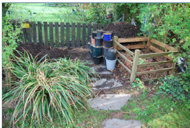
Abb. 24: Eigenkompostierung mit drei Haufen, die zwischen null und drei Jahre alt sind. Daneben wird Strauchschnitt gelagert, der unter Rasenschnitt gemischt wird, um diesen aufzulockern.

Organische Substanz zerfällt in der Natur ganz von selbst durch Oxidation (Sauerstoffeinwirkung; auch als „kalte Verbrennung“ bezeichnet). Außerdem dadurch, dass Bakterien, Pilze und eine Vielzahl an Kleintieren die organische Substanz zerlegen. Dabei wird die Energie frei, die als Sonnenenergie beim Wachstum zugeführt wurde. Es ist der ständige Kreislauf der Natur. Dieses Prinzip macht sich der Mensch zu Nutze und kompostiert seinen Rasen- und Strauchschnitt (Grüngut) sowie seine rohen Bioabfälle aus der Küche. Die freiwerdende Energie erwärmt den Komposthaufen.