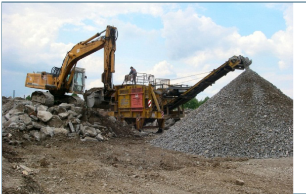
Abb. 21: Aufbereitung (Recycling) der Betonbahn eines ehemaligen Flugplatzes.

Das Recycling – auch als werkstoffliche Verwertung bezeichnet – ist die hochwertigste Form der Verwertung. Sie steht in der Abfall-Hierarchie vor der energetischen oder einer sonstigen stofflichen Verwertung. Recycling bedeutet, dass Wertstoffe aus Abfällen so lange wie möglich im Kreislauf gehalten werden. Der Kreislauf beginnt in der Regel mit der Produktion aus Primärrohstoffen, wird mit der Vermarktung der Produkte und deren Nutzung (von einem oder mehreren Besitzern) fortgesetzt, führt über die Entsorgung als Abfall zur Verwertung und damit zur Gewinnung von Sekundärrohstoffen für den erneuten Kreislauf. Das ist jedoch nur möglich, wenn dieser Kreislauf schadstofffrei gehalten wird.