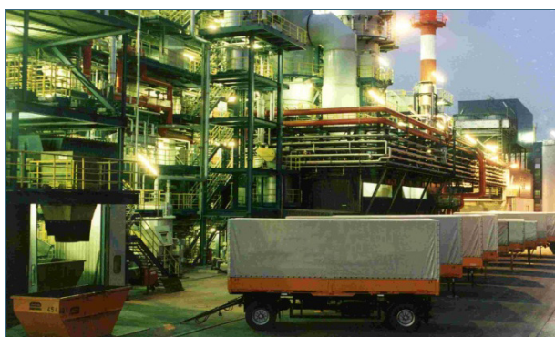
Abb. 34: Sonderabfallverbrennungsanlage der gsb.

Das Bayerische Landesamt für Umwelt (LfU) ist mit seiner Zentralen Stelle Abfallüberwachung (ZSA) 33 die Behörde zur Überwachung der Entsorgung von Sonderabfällen in Bayern. Das LfU überwacht auch die Anlagen zur Beseitigung der Sonderabfälle. Auf Basis der Begleitscheine und Nachweislisten erstellt es regelmäßig die Sonderabfallstatistiken 34 .