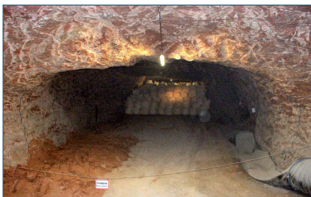
Abb. 28: Um Bergschäden zu vermeiden, nutzt man für den „Bergversatz“ nur standfeste Abfälle.

Stollen und Strecken stillgelegter Bergwerke oder Bergwerksteile werden mit Abfällen verfüllt. Um Bergschäden infolge einbrechender Hohlräume zu vermeiden kann nur standfester Abfall verfüllt werden. Außerdem muss ausgeschlossen werden, dass Grundwasser Zutritt, Schadstoffe löst und austrägt. Geeignet hierfür sind Salzbergwerke. Die Abfälle dürfen sich auch nicht mehr derart umsetzen, dass sie miteinander reagieren, höhere Temperaturen oder Gase entwickeln oder sich selbst entzünden können.