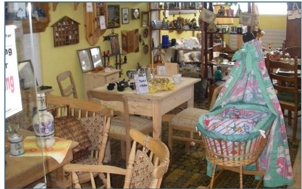
Abb. 15, 16: Egal ob Kleider, Spielsachen, Geschirr, Bücher oder Möbel – in Gebrauchsgüterläden findet man gut Erhaltenes zu Flohmarktpreisen. Diese Läden brauchen auch Nachschub!