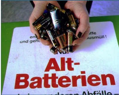
Abb. 25: Aus Batterien werden Metalle wie Nickel und Blei gewonnen. Zink aus Zink-Kohle-Batterien lässt sich z. B. für die Herstellung von Sonnencreme verwenden.