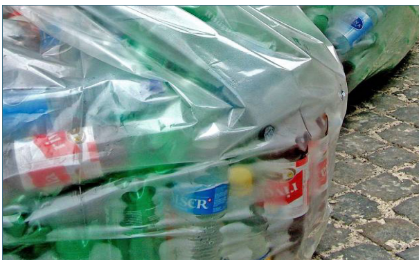
Abb. 22: Beispiel für ein perfektes Recycling ist die Herstellung neuer PET-Flaschen aus alten PET-Flaschen (Polyethylenterephthalat). 23

Deshalb – und um wieder handhabbare „Bausteine“ zu gewinnen – werden die Wertstoffe zuvor aufbereitet 22 . Beispielsweise werden Beton und Glas gebrochen (siehe Abb. 21) und gewaschen, Kunststoffe geschreddert, gewaschen und granuliert. Kraftfahrzeuge werden nach Trockenlegung und Verdichtung in einer Presse geschreddert und in den einzelnen Fraktionen sortenrein erfasst. Alttextilien werden gerissen und geschnitten oder es werden Wollfäden gewonnen. Papier wird aufgelöst, von den Druckfarben befreit und gebleicht. Unbehandeltes bzw. naturbelassenes Altholz wird geschreddert, mit Bindemittel versetzt und zu Spanplatten verpresst. Lösemittel, Säuren, Basen und Öle werden regeneriert. Brennbare Abfälle werden als Ersatzbrennstoff zu der vom Kunden (z. B. einem Zementwerk) gewünschten Mischung zusammengestellt.