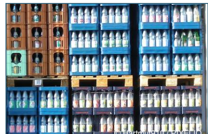
Abb. 4, 5, 6: Wer mit dem eigenen Korb auf dem Markt einkauft und Mehrwegflaschen verwendet, vermeidet Abfall.