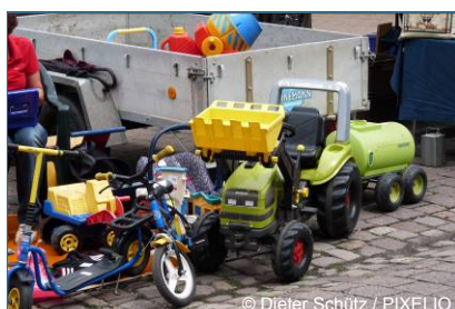
Abb. 1: Wiederverwendung: Gebrauchte Spielsachen finden z. B. auf dem Flohmarkt neue Besitzer.

Voraussetzung für die Wieder- oder Weiterverwendung sind langlebige Produkte. Deshalb sollte beim Kauf auf gute Qualität geachtet und das erworbene Produkt auch gepflegt werden. Dann besteht die Chance, dass es vom Erstbesitzer lange verwendet oder von weiteren Besitzern wiederverwendet werden kann. Je länger ein Produkt im Umlauf ist, desto effizienter werden die bei der Produktion eingesetzten Ressourcen genutzt. Umwelteingriffe, die bei der Produktion zwangsläufig erfolgten, können besser verantwortet werden, neue primäre Ressourcen (Bodenschätze) bleiben geschont. Abfallvermeidung stößt jedoch an Grenzen, sobald es dank neuer Erkenntnisse oder eines besseren Standes der Technik bereits umweltfreundlichere Produkte gibt, die deutlich weniger Schadstoffe abgeben (wie neue Kraftfahrzeuge) oder weniger Energie verbrauchen (wie Kühlschränke mit klimafreundlichem Kühlmittel).