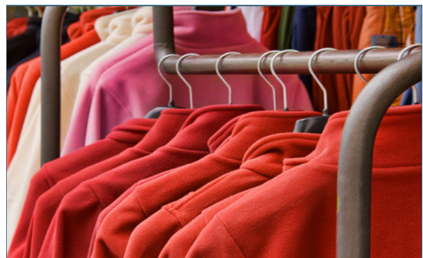
Abb. 23: Werden aus PET-Fasern Kleider hergestellt, ist der Kreislauf streng genommen bereits unterbrochen, weil diese nach erneuter Nutzung nur noch energetisch verwertet werden können.