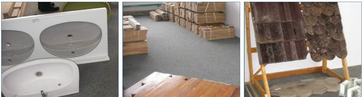
Abb. 11, 12, 13: Auf Bauteilbörsen kann man gebrauchte Teile für Bad, Fußboden und Dach sowie viele andere Positionen günstig kaufen.

Derzeit entsteht in Deutschland ein Netz von Bauteilbörsen, um auch immobile, weil eingebaut gewesene Bauteile aus der Baurestmasse wieder- oder weiterzuverwenden und dadurch Abfall zu vermeiden. Geeignet sind vor allem Einbauten, Freitreppen, Türen, Fenster, Innen- und Außenbodenbeläge wie Parkett und Trittsteine, Holzbalken, Ziegel, Dachschindeln, Glasbausteine, Fliesen und Kacheln (jeweils nur in relevanter Menge), Sanitäranlagen, Anbauten wie Wintergärten und Überdachungen, Zäune und vieles andere mehr.