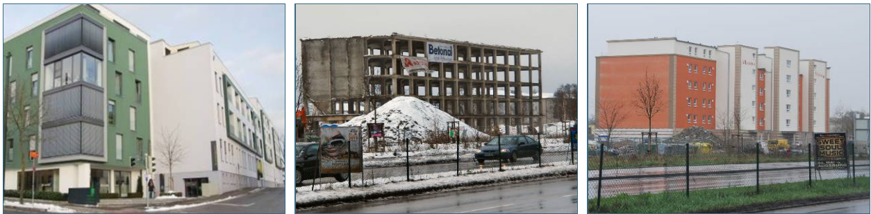
Abb. 8, 9, 10: Bei der Sanierung lässt sich nachhaltig Bauschutt vermeiden, wenn das alte Gebäude weitestgehend erhalten und modernisiert (Bild links) oder nur teilweise erhalten wird. Aus der bewahrten Stahlskelettstruktur eines Kasernenbaus (Bild Mitte) entstand ein modernes Heim für betreutes Wohnen (Bild rechts).

Das Statistische Bundesamt (Destatis) ermittelte in der Abfallbilanz 2010 für Deutschland pro Einwohner und Jahr allein 658 kg Beton, Ziegel, Fliesen und Keramik als Teilfraktion aus dem noch viel größeren Bau- und Abbruch-Abfallspektrum. Entsprechend dringend ist es, Konzepte zu entwickeln, um auch Bauabfälle zu vermeiden oder – wenn doch abgebrochen werden muss – sortenrein zu erfassen, aufzubereiten und wieder als Baustoff einzusetzen.