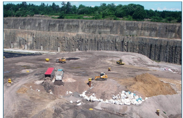
Abb. 33: Heute müssen alle organischen Abfälle vorbehandelt werden. Auf die Deponie dürfen nur mineralische Abfälle: Aschen aus der Abfallverbrennung (grau), kontaminiertes Erdreich (ocker), Abfälle aus der mechanisch-biologischen Behandlung (erdig) und Asbest bzw. künstliche Mineralfasern (Säcke).