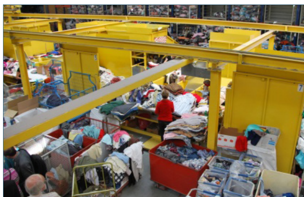
Abb. 14: Gebrauchtkleidersortierung in einem der größeren deutschen Sortierfachbetriebe.

Saubere Bekleidung kann auch über Kleidercontainer oder Straßensammlungen karitativ-gemeinnütziger oder gewerblicher Betriebe weitergegeben werden. Es muss jedoch zu erkennen sein, wer für die Kleidersammlung verantwortlich ist. Wenn keine vollständige Adresse angegeben ist, sondern nur Telefon- oder Handynummern, unter denen dann niemand zu erreichen ist, oder Hilfsorganisationen aus weit entfernten Regionen genannt werden, ist Vorsicht geboten. Dieses Sammelgut geht häufig unsortiert und damit als Abfall auch illegal ins Ausland. In Deutschland gibt es eine ganze Reihe Sortierfachbetriebe, die Kleider, Schuhe etc. hochqualifiziert sortieren und einer weiteren Verwendung oder Verwertung zuführen. Bis zu 50% der Kleider und Schuhe können wieder verwendet – und damit letztlich als Abfall vermieden – werden.