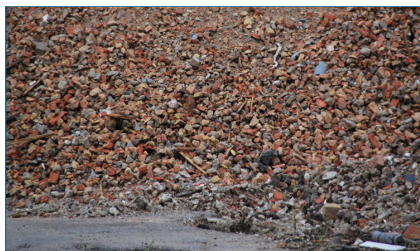
Abb. 19, 20: Ein Abbruch ganzer Häuser mit dem Bagger führt zu Gemischen mineralischer Abfälle, aus denen in der Regel nichts Hochwertiges mehr hergestellt werden kann.