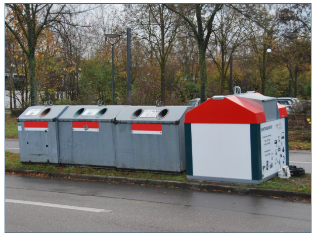
Abb. 17,18: Ob Hol- oder Bringsystem – wichtig ist, dass die Wertstoffe sortenrein gehalten werden. Nicht zulässig und strafbar ist allerdings die Ablagerung neben den Containern.

Zweifeln am Sinn der Wertstofftrennung kann Folgendes entgegnet werden: