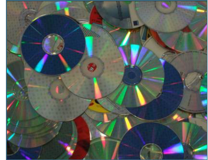
Abb. 27: Aus CD-Rezyklat können Produkte für die Computerindustrie oder für die Medizintechnik hergestellt werden.