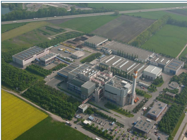
Abb. 29: Abfallverwertungsanlage Augsburg (AVA)

Von 1.000 kg Abfall verbleiben nach der Verbrennung durchschnittlich rund 240 kg Aschen und Schlacken sowie 15 kg Filterstaub und Reaktionsprodukte (Rückstände der Rauchgasreinigung).