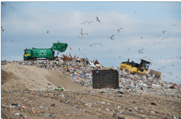
Abb. 32: Unbehandelte Siedlungsabfälle, wie hier auf einer Deponie in Tallinn/Estland, dürfen in Deutschland seit 2005 nicht mehr deponiert werden.

Im Jahr 2010 wurden in Bayern nur noch 33 kg Abfall pro Einwohner und Jahr auf Deponien der Klassen 1 und 2 deponiert. Diese Menge schließt auch belasteten Bauschutt, belastetes Erdreich und asbesthaltige oder (künstliche) Mineralfaserhaltige Abfälle mit ein.