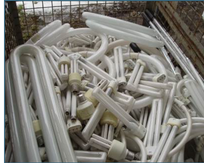
Abb. 26: Energiesparlampen und Leuchtstoffröhren enthalten viele Wertstoffe, die für neue Produkte benötigt werden.