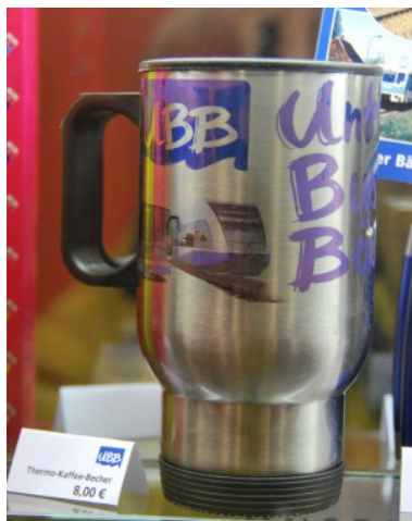
Abb. 7: Wer für das regelmäßige Coffee-to-go seinen eigenen Thermobecher nutzt, vermeidet Abfälle.

Vielerorts verleihen Kommunen und Vereine Geschirr, Besteck und Tischwäsche. So kann auf die Einwegvarianten verzichtet werden. Auch beim regelmäßigen Coffee-to-go lassen sich mit einem eigenen Thermobecher Zeichen setzen.