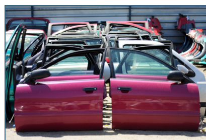
Abb. 3: Vorbereitung zur Wiederverwendung: Gebrauchte Autoteile werden ausgebaut. Statt sie zu pressen und zu schreddern, können sie wiederverwendet werden.

Vorbereitung zur Wiederverwendung bedeutet, dass etwas, was bereits zu Abfall geworden ist, weil es nicht mehr benötigt und entsorgt wurde, durch Prüfung (z. B. Sortierung), Reinigung oder Reparatur (auch unter Einbau gebrauchter Teile) ganz oder teilweise einer erneuten Verwendung zugeführt werden kann. Beispiele sind Gegenstände oder Materialien aus dem Sperrmüll, Geräte oder Fahrzeuge (auch Fahrräder), die demontiert und als Einzelteile zur Wiederverwendung vorbereitet werden. Damit wird letztlich Abfall vermieden.