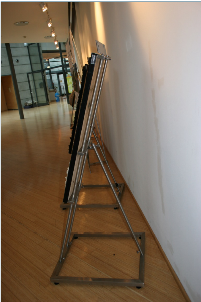
Abb. 5: Aufgebauter Lackprofilständer von der Seite