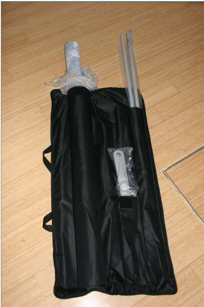
Abb. 14: Tasche mit Ausstellungsbanner und Ständer