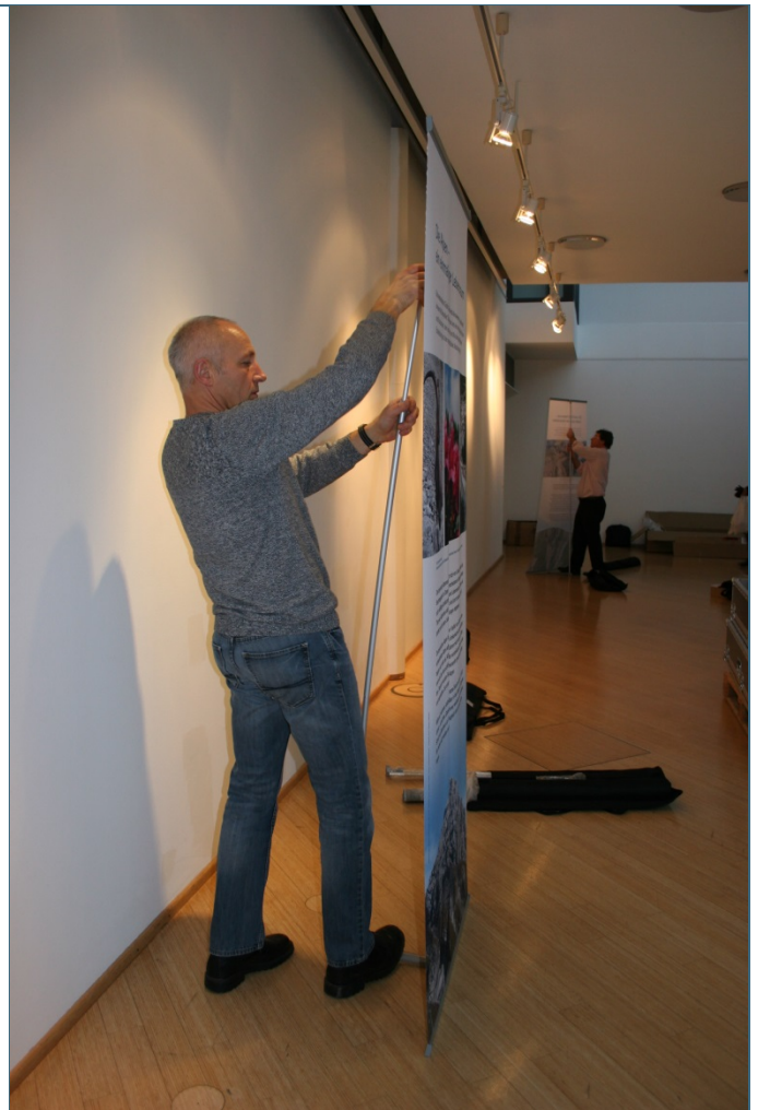
Abb. 15: Aufbau der Banner