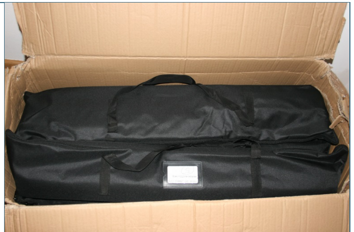
Abb. 13: einzelne Taschen mit den Bannern (nummeriert)