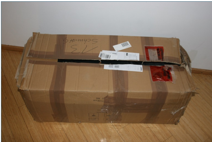
Abb. 12: Transportkarton mit den Ausstellungsbannern