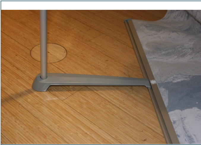
Abb. 16: Befestigung unten