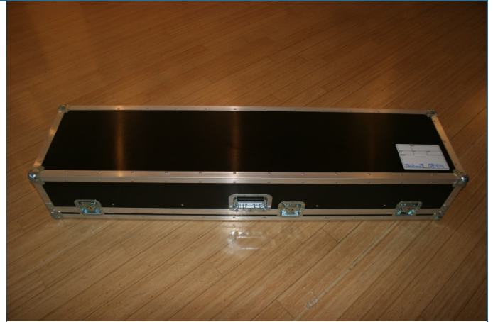
Abb. 8: einzelne Transportkiste (Länge: 160cm x Breite: 40cm x Höhe 28 cm)