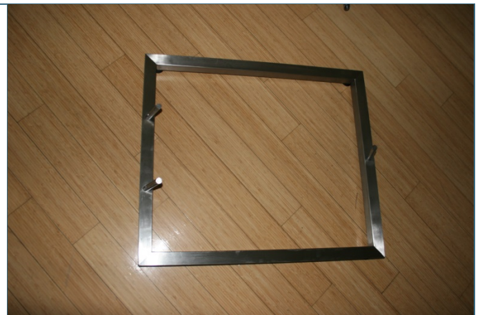
Abb. 2: Ständerfuß: Länge: 70cm x Breite: 60cm x Höhe: 5cm