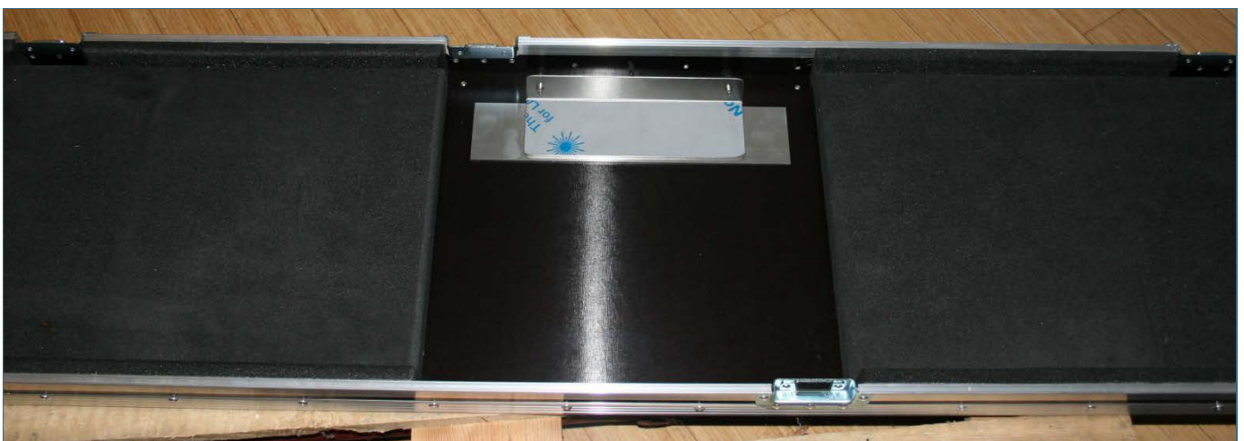
Abb. 11: unter dem Lackprofil befindet sich das Beschriftungsschild