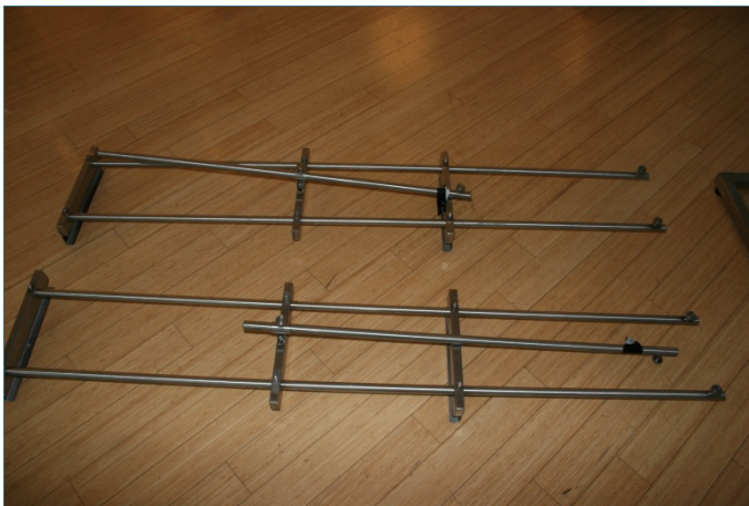
Abb. 1: 3-Bein-Gestänge: Länge: 160cm x Breite 30cm