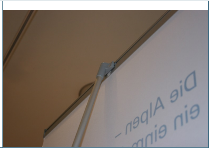
Abb. 17: Befestigung oben