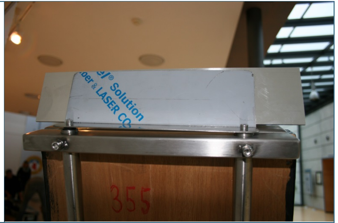
Abb. 4: Befestigung des Beschriftungsschildchens