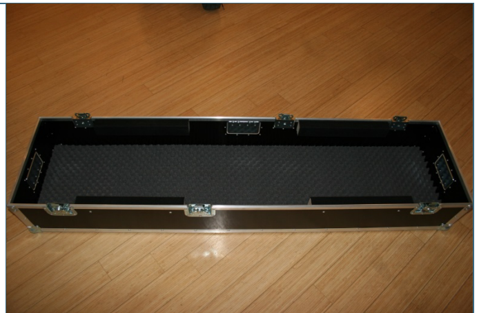
Abb. 10: Deckel der Transportbox