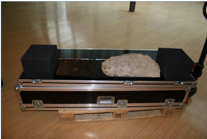
Abb. 9: Kistenboden mit Polster und Lackprofil