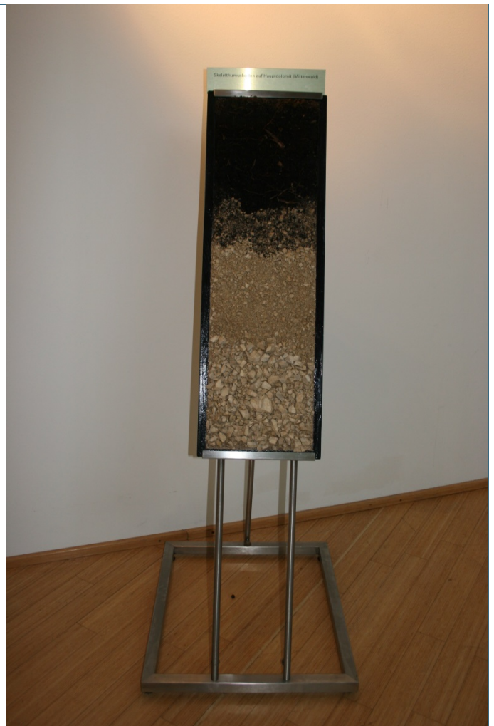
Abb. 6: Aufgebauter Lackprofilständer von Vorne