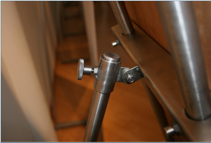
Abb. 3: Befestigung des 3-Bein-Gestänges